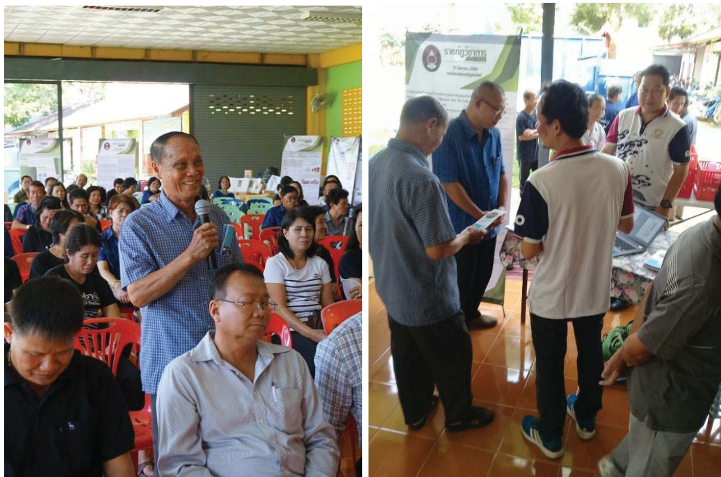
ถ่ายทอดนวัตกรรมองค์ความรู้กลไกการนำนโยบายสู่การปฏิบัติ วันที่ 29 – 30 มีนาคม 2561 ณ โรงเรียนศรีสวัสดิ์วิทยาคาร เครือข่ายเข้าร่วมประมาณ 200 คน