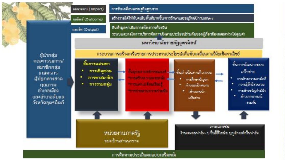
แผนภูมิที่ 11 กลไกการขับเคลื่อนเครือข่ายการประสานประโยชน์เพื่อขับเคลื่อนงานวิจัยเชิงพาณิชย์ จังหวัดอุดรดิตถ์ กรณีศึกษากลุ่มเกษตรกรผู้ปลูกกลางสาดจังหวัดอุดรดิตถ์

กลไกการขับเคลื่อนที่สำคัญในการสร้างเครือข่ายประสานประโยชน์ ได้แก่ ผู้นำกลุ่ม คณะกรรมการของกลุ่ม และสมาชิกกลุ่ม ภาคีเครือข่ายหลักที่ช่วยสนับสนุนและผลักดัน ได้แก่ มหาวิทยาลัยราชภัฏอุดรดิตถ์ (ด้านวิชาการ งบประมาณ) องค์การบริหารส่วนตำบลบ้านดำนานาขาม (ด้านสถานที่ บุคลากร)