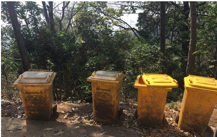
รูปภาพที่ 4.17 ถังขยะที่ทาง อบต.สกาตเตรียมไว้ให้ประชาชน

จากการนัดหมายของ คุณอนัญญา สารไชย ให้เข้าพบ นายสนธิ พรหมรักษ์ จัดเก็บ ทั้ง 4 หมู่บ้าน โดยมีการเก็บขยะตามจุดต่าง ๆ อาทิตย์ละ 3 วัน หรือ วันเว้นวัน แล้วแต่ ปริมาณขยะมีมากหรือน้อย ผู้รับเหมาเป็นคนในชุมชนจะคอยสังเกตปริมาณขยะในแต่ละจุดว่ามีมากจนเต็มถังหรือยัง หากปริมาณขยะมีมาก ก็จะนำรถมาเก็บ เพื่อนำไปเผาทำลาย ณ จุดจัดการขยะ โดยก่อนการเผาจะคัดแยกขยะรีไซเคิลที่สามารถนำไปขายได้ แยกออกเป็น ส่วน ๆ แล้วนำมาเก็บไว้บริเวณบ้านพักเมื่อมีปริมาณที่มากพอจึงนำลงไปขายร้านค้าขนาดใหญ่ ในอำเภอปัว