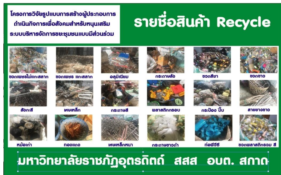
รูปภาพที่ 4.24 สินค้ารีไซเคิลที่ทางร้านต้องการรับซื้อ