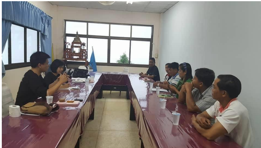
รูปภาพที่ 4.3 แสดงการประชุมเพื่อหาแนวทางการแก้ปัญหาพร้อมกับผู้นำชุมชน

องค์ความรู้เรื่องการคัดแยกขยะ สามารถถ่ายทอดวิธีการคัดแยกให้กับประชาชน มีทัศนคติที่ต่อการคัดแยกขยะ ไม่รังเกียจขยะรีไซเคิล มีองค์ความรู้เรื่องการทำธุรกิจ เป็นผู้ประกอบการ และสร้างเครือข่ายเนื่องจากราคาของขยะรีไซเคิลแต่ละประเภทจะมีการปรับราคา ขึ้นลง มีสถานที่ที่จะจัดเก็บขยะรีไซเคิลให้ได้ปริมาณที่มากในระดับหนึ่ง จึงจะสามารถนำออกมาขายได้ เพื่อให้ประหยัดค่าขนส่ง ผู้ประกอบการรับเหมาเก็บขยะในชุมชน