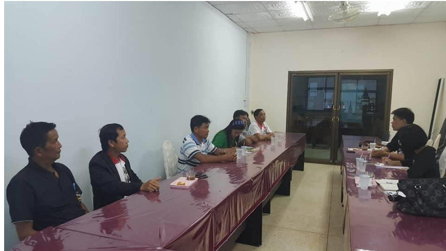
รูปภาพที่ 4.19 การประชุมเพื่อสรุปปัญหาและหาแนวทางการทำงาน

ที่นำมาขายก็ได้รับราคาที่เป็นธรรม มีกำลังใจในการคัดแยกขยะภายในบ้าน และชุมชน มีองค์ความรู้ เรื่องการคัดแยกขยะ สามารถถ่ายทอดวิธีการคัดแยกให้กับประชาชน มีทัศนคติที่ต่อการคัดแยกขยะ ไม่รังเกียจขยะรีไซเคิล มีองค์ความรู้เรื่องการทำธุรกิจ เป็นผู้ประกอบการ และสร้างเครือข่ายเนื่องจาก ราคาของขยะรีไซเคิลแต่ละประเภทจะมีการปรับราคา ขึ้นลง มีสถานที่ที่จะจัดเก็บขยะรีไซเคิลให้ได้ ปริมาณที่มากในระดับหนึ่ง จึงจะสามารถนำออกมาขายได้ เพื่อให้ประหยัดค่าขนส่ง