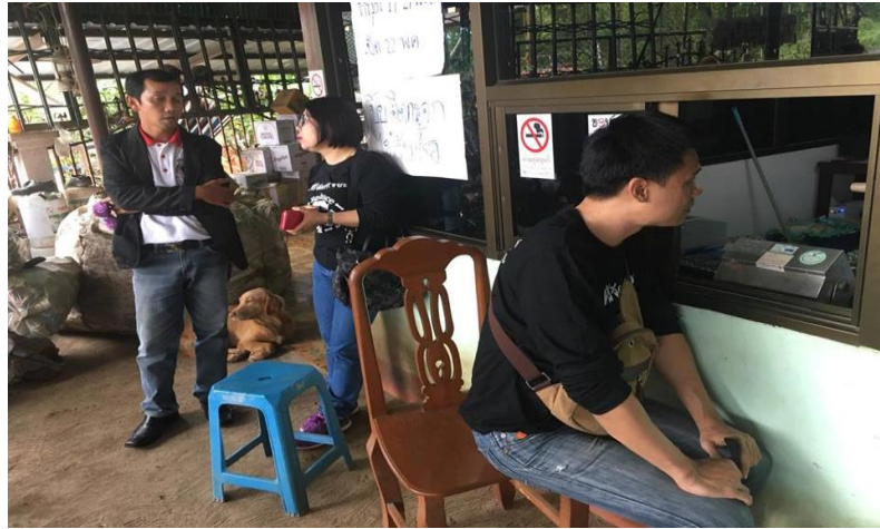
รูปภาพที่ 4.23 ผู้วิจัยได้ลงสำรวจร้านค้าผู้ประกอบการรับซื้อขยะรีไซเคิลขนาดใหญ่ที่ อ.ปัว