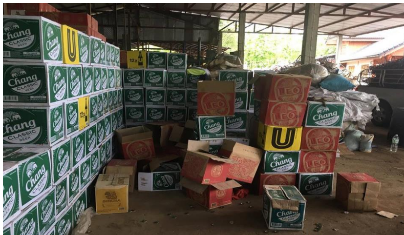
รูปภาพที่ 4.27 ธุรกิจร้านค้ารับซื้อขยะรีไซเคิลผู้กำหนดราคารับซื้อ

3.3 การบริหารจัดการพื้นที่การจัดเก็บขยะโดยการใช้เทคโนโลยีเครื่องบีบอัดขยะพวกขวดพลาสติก อลูมิเนียม หรือ เหล็ก ในลักษณะของการบีบอัดเป็นก้อน