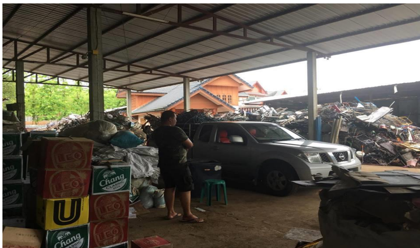
รูปภาพที่ 4.14 ผู้ประกอบการรับซื้อขยะรีไซเคิล อ.บัว

ราคาซื้อขายในตลาดถูกกำหนดมาจากสมาคมผู้รับซื้อของเก่า หรือโรงงานแปรรูปขนาดใหญ่ ที่กำหนดราคารับซื้อมา โดยการแจ้งปรับราคาเป็นแบบรายวัน ผ่านทางร้านรับซื้อของเก่า หรือการส่ง ข้อความแก่เจ้าของร้านขนาดใหญ่ เนื่องจากต้นทุนในการรับซื้อของเก่า มีการผันผวน เมื่อราคาขึ้น หรือลงทางโรงงานจะแจ้งให้ลูกค้าทราบก่อนล่วงหน้า 1 วัน จากนั้นร้านรับซื้อจะคำนวณจากราคาขาย ของวัสดุหลังการคัดแยก โดยหักต้นทุนการบริหารจัดการ และกำไร ที่คาดหวัง แล้วนำไปปรับเป็น ราคาที่รับซื้อจากลูกค้ารายย่อย โดยแจ้งผ่านทางป้ายราคารับซื้อหน้าร้าน และการโทรศัพท์ติดต่อกับ ลูกค้าประจำ ราคาซื้อขยะจะแปรผันกับชนิดและประเภทของขยะ หากลูกค้าคัดแยกประเภทขยะ มาแล้ว ราคาซื้อจะสูงกว่ากรณีที่ลูกค้านำขยะคละประเภทมาขาย