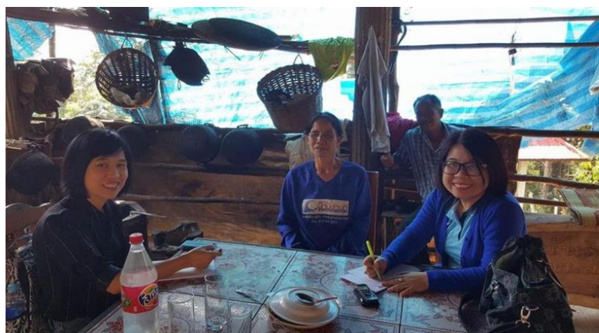
รูปภาพที่ 4.18 พบปะแลกเปลี่ยนแนวคิด ผู้ประกอบการขยะรีไซเคิล

กระบวนการการคัดแยกที่ดี จะสามารถนำไปขายได้ราคาดีมากขึ้น หากแต่ยังพบว่า การเป็นผู้ประกอบการขายขยะรีไซเคิลจำเป็นต้องมีการบริหารจัดการ เรื่องสถานที่จัดเก็บ วิธีการจัดเก็บหากมีเครื่องมือ ปีบอัดก็จะสามารถลดพื้นที่การจัดเก็บ และการขนส่งจะสามารถขนส่งได้จำนวนมาก ๆ ซึ่งเป็นการประหยัดน้ำมัน ในการขนไปขายให้กับร้านรับซื้อขยะรีไซเคิล