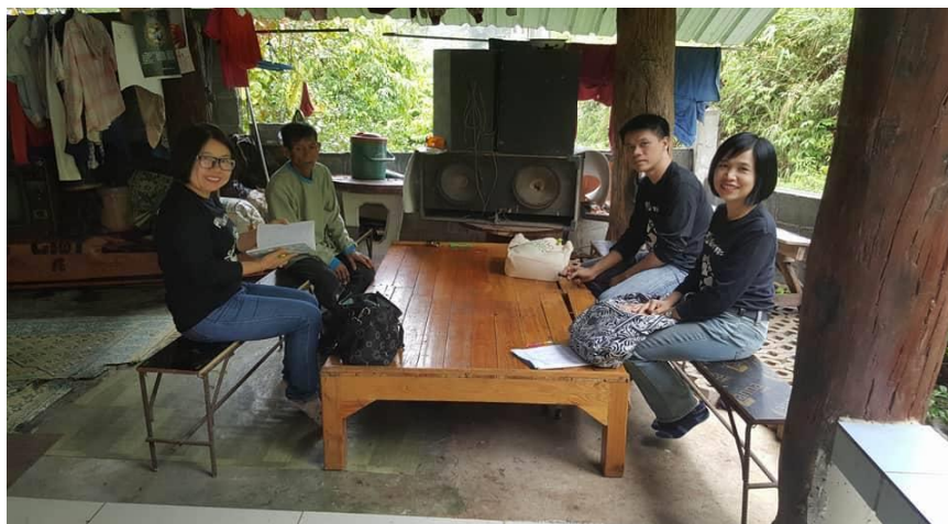
รูปภาพที่ 4.18 พบปะแลกเปลี่ยนแนวคิด ผู้ประกอบการขยะรีไซเคิล

กระบวนการการคัดแยกที่ดี จะสามารถนำไปขายได้ราคาดีมากขึ้น หากแต่ยังพบว่า การเป็นผู้ประกอบการขายขยะรีไซเคิลจำเป็นต้องมีการบริหารจัดการ เรื่องสถานที่จัดเก็บ วิธีการจัดเก็บหากมีเครื่องมือ ปีบอัดก็จะสามารถลดพื้นที่การจัดเก็บ และการขนส่งจะสามารถขนส่งได้จำนวนมาก ๆ ซึ่งเป็นการประหยัดน้ำมัน ในการขนไปขายให้กับร้านรับซื้อขยะรีไซเคิล