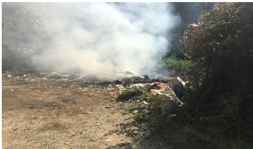
รูปภาพที่ 4.4 ป่อขยะ แบบฝังกลบ ของตำบลสกาด