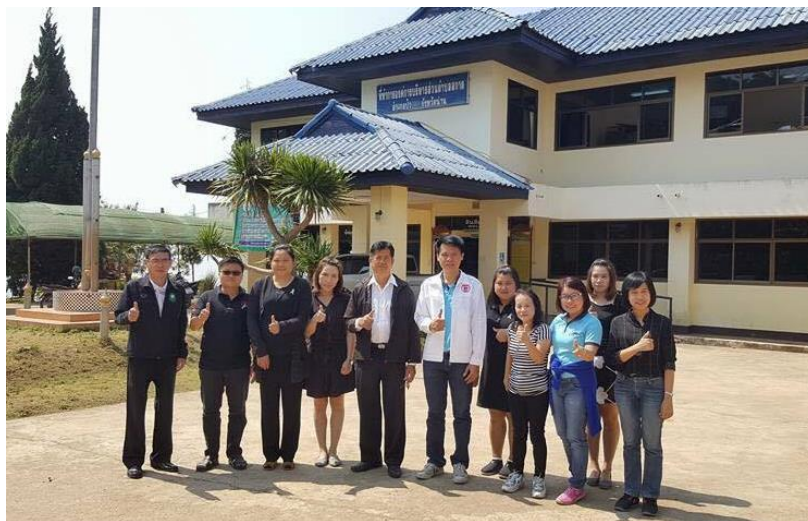
รูปที่ 4.27 นักวิจัยคืนข้อมูลให้กับ อบต.สกาด

4. การปรับปรุงแก้ไข (Action) กลุ่มใช้วิธีการประชุมเพื่อแลกเปลี่ยนความคิดเห็นเกี่ยวกับแนวทางในการจัดเก็บขยะเนื่องจากมีการเปลี่ยนแปลงราคาทุกวัน ดังนั้น เพื่อให้สอดคล้องกับการวางแผนการขายให้ได้ราคาสูงสุด จึงควรทำการศึกษาถึงการเปลี่ยนแปลงของราคาจะทำให้ได้ผลตอบแทนที่ดีที่สุด อีกทั้ง เมื่อมีสถานการณ์หรือปัญหาเกิดขึ้นจะใช้วิธีการแบ่งปันความรู้ร่วมกันซึ่งช่วยให้กลุ่มสามารถช่วยกันแก้ไขปัญหาได้อย่างเหมาะสม