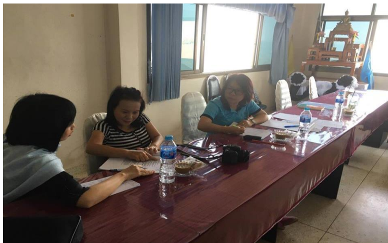
รูปภาพที่ 4.22 การประชุมวางแผนการทำงานร่วมกับ อบต.สกาต

การวางแผนร่วมกับกลุ่มผู้ประกอบการในการกำหนดวัตถุประสงค์การดำเนินงานเกี่ยวกับการรับซื้อขยะรีไซเคิลเพื่อขายโดยใช้ความคิดสร้างสรรค์ในการประกอบธุรกิจเพื่อสังคมโดยมีการวางแผนเป้าหมายการดำเนินงานคือ การลดปริมาณขยะในชุมชน การใช้เวลาว่างให้เป็นประโยชน์และสร้างรายได้ โดยยึดหลักการค้าที่เป็นธรรม และมีจิตสาธารณะ โดยผู้วิจัยได้ลงสำรวจร้านค้าผู้ประกอบการรับซื้อขยะรีไซเคิลขนาดใหญ่ที่ อ.ปัว เพื่อนำมาวางแผน ในการรับซื้อขยะรีไซเคิลจากชุมชน