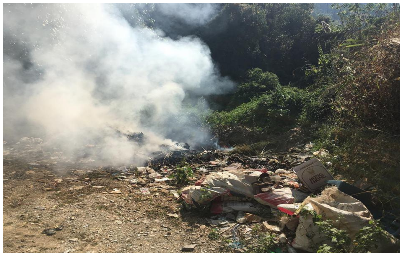
รูปภาพที่ 4.1 บ่อขยะ แบบฝังกลบ ของตำบลสกาต