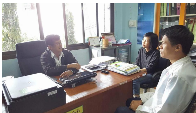
รูปภาพที่ 4.16 การประสานงานเพื่อทราบบริบทของ ต.สกาต ปลัดอบต.

ซึ่งจะพบปัญหาเรื่องความร่วมมือของชุมชน ประชากรมีน้อย ลักษณะการใช้ชีวิตที่เป็นแบบชาวเขา มีความเป็นอยู่แบบพอเพียง การบริโภคสินค้าต่าง ๆ มีน้อยจึงมีปริมาณขยะในแต่ละวันน้อย ปัญหาขาดผู้ประกอบการรับซื้อขยะรีไซเคิล เนื่องจากเป็นพื้นที่เขาสูง ประชากรอาศัยอยู่ไม่มาก ปริมาณขยะมีไม่เพียงพอ กับการลงทุนขึ้นมาซื้อจึงเป็นสาเหตุให้โครงการจัดการขยะไม่ประสบความสำเร็จ ส่งผลให้ประชาชนขาดกำลังใจ เนื่องจากเก็บสะสมขยะรีไซเคิลไว้แต่ขายไม่ได้ราคา ทำให้บ้านเรือนของตนดูรุงรัง และมีปัญหาเรื่องการจัดการความสะอาด