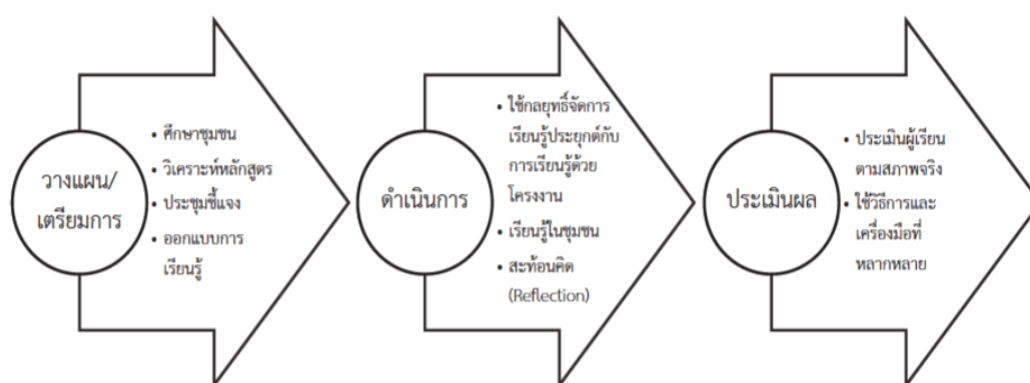
ภาพที่ ๔ กระบวนการจัดการเรียนรู้โดยใช้ชุมชนเป็นฐาน