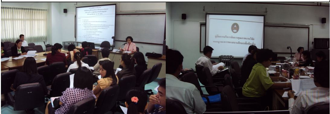
การประชุมแลกเปลี่ยนเรียนรู้