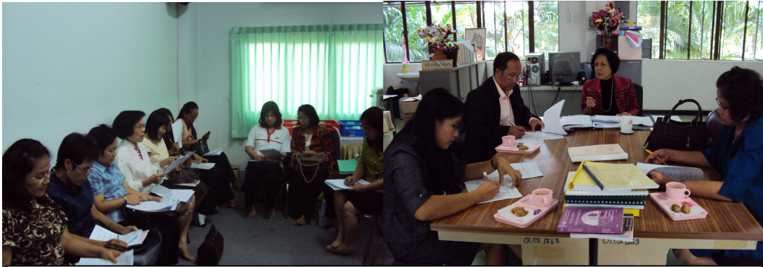
เยี่ยมชมตามการปฏิบัติงานวิจัยของสถานศึกษาในเครือข่าย