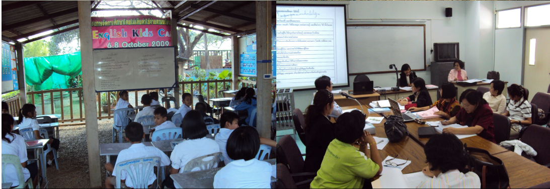
เยี่ยมชมแหล่งเรียนรู้ที่เป็นองค์กรภาคี