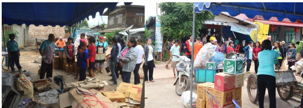
ภาพที่ 5.17 กิจกรรมการคัดแยกขยะ

กิจกรรมการคัดแยกขยะอินทรีย์ ขยะรีไซเคิล ขยะอันตราย และขยะทั่วไป โดยชุมชน สถานประกอบการ หรือ สถาบันการศึกษา/โรงเรียน โดยการคัดแยกแต่ละบ้าน คัดแยกต้นทางโดยตัวแทนอาสาแต่ละหมู่บ้าน คัดแยกแต่ละบ้านนำไปรวม สำนักงาน อบต.