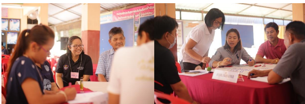
ภาพที่ 5.10 การแสดงความคิดเห็นในกลุ่มย่อยการจัดการขยะใน

กิจกรรมย่อย โดยการแบ่งกลุ่มให้ ผู้นำร่วมกันเสนอแนวปฏิบัติที่ดี ในการจัดการขยะในชุมชน โดยยึดหลักการความรู้ที่ได้ จากกิจกรรมที่1-4 มาประยุกต์ ใช้กับชุมชนของตนเองเพื่อให้ชุมชนเกิดการพัฒนาในทางที่ดี มีการปฏิบัติที่ดี และให้นำเสนอ 5-10 นาที เพื่อเป็นข้อคิดแลกเปลี่ยนเรียนรู้ร่วมกัน