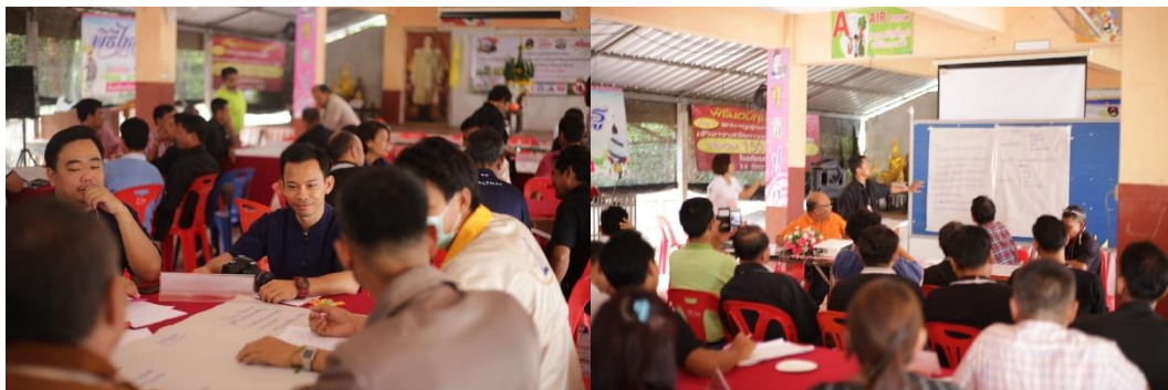
ภาพที่ 5.11 การเตรียมสื่อนำเสนอในแต่ละกลุ่มย่อย

กิจกรรมย่อย การนำเสนอแนวปฏิบัติที่ดี ในการจัดการชุมชน การจัดการขยะในชุมชน โดยการนำเสนอจะมี กฎกติกา การประชุมกลุ่ม การทำประชาคม การติดตามในการดำเนินการ ซึ่งเป็น การแลกเปลี่ยนเรียนรู้ซึ่งกันและกัน ถือได้ว่าเป็นแนวทางที่สามารถพัฒนาชุมชนในด้านการจัดการ ขยะได้เป็นอย่างดี