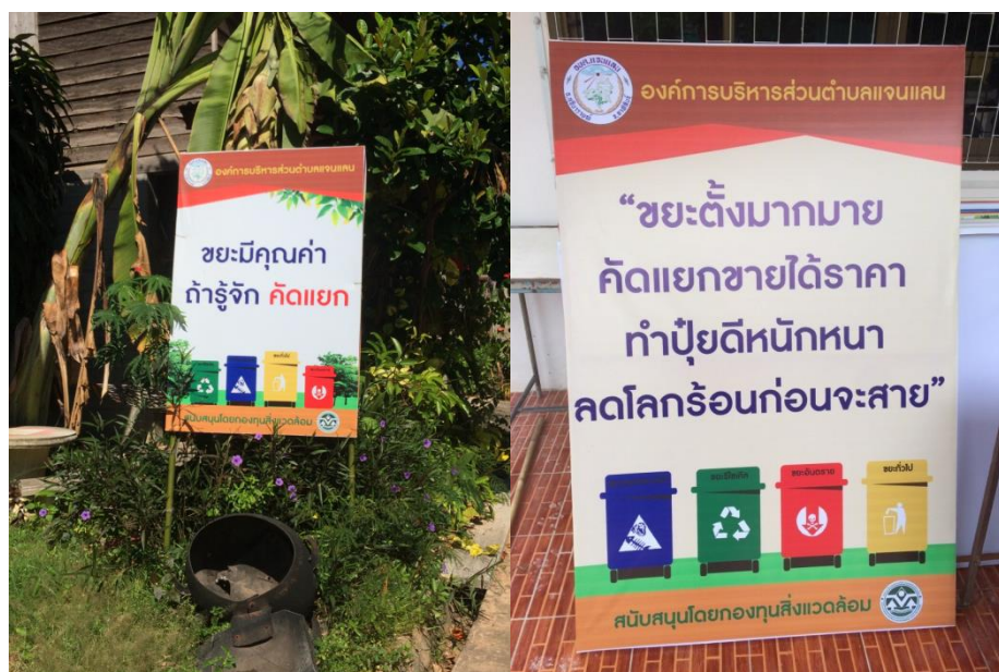
ภาพที่ 5.16 การจัดทำสื่อประชาสัมพันธ์

การทำป้ายประชาสัมพันธ์ป้ายรณรงค์ ป้ายประชาสัมพันธ์ติดในชุมชนหมู่ 6 เพื่อสร้างความตระหนักให้กับคนในชุมชน