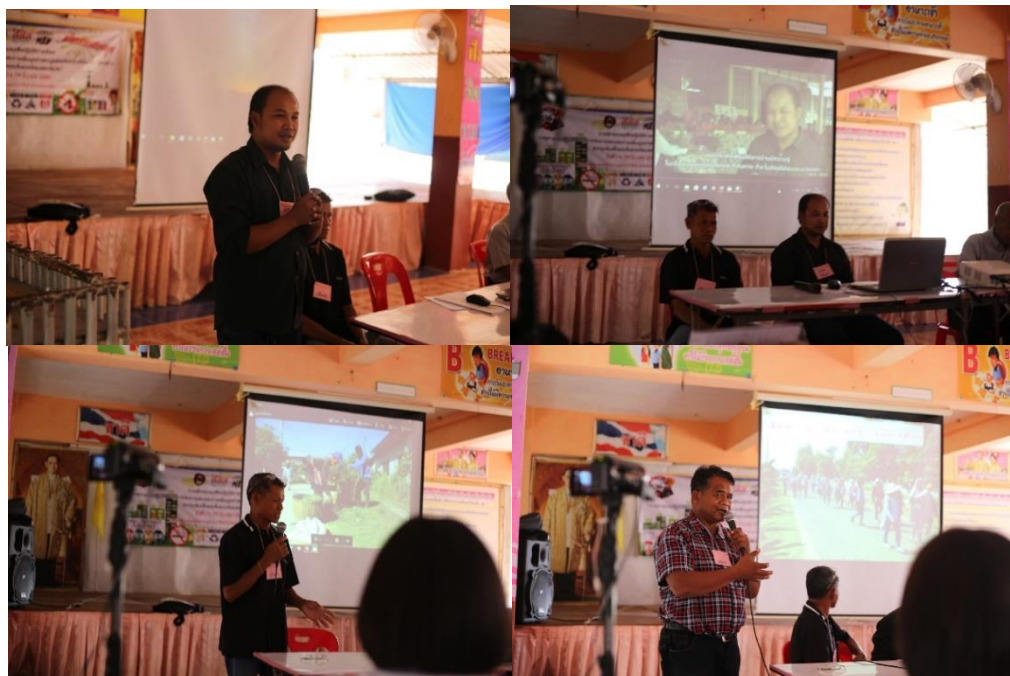
ภาพที่ 5.4 การบรรยายเรื่องบ้านสะอาดชุมชนน่าอยู่

กิจกรรมที่ 2 การสร้างความเข้มแข็งในการจัดการตนเองให้ชุมชนน่าอยู่ ในการจัดการตนเองของชุมชนเน้นการมีส่วนร่วมของชุมชน มีกติกา กฎระเบียบของชุมชนร่วมกัน โดยกฎระเบียบข้อบังคับของชุมชนที่ปฏิบัติร่วมกัน ได้มาจากการประชุมของชาวบ้าน แกนนำต่างๆ ออกมาเป็นข้อปฏิบัติที่ชุมชนยอมรับและสามารถปฏิบัติได้ ส่งผลให้ชุมชนเป็นระเบียบ