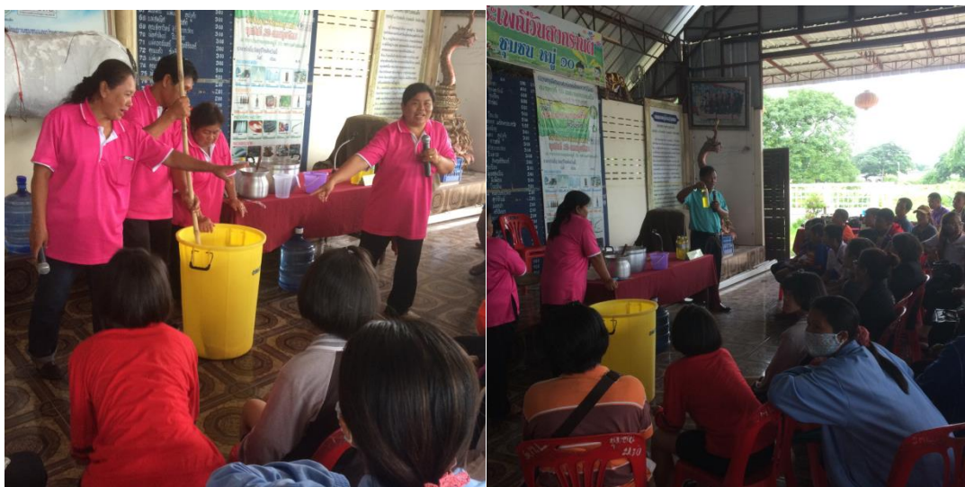
ภาพที่ 5.18 การจัดการขยะแต่ละประเภท

การจัดการขยะแต่ละประเภท เก็บรวบรวม บำบัด หรือกำจัด หรือนำไปใช้ประโยชน์ และการจัดการขยะอินทรีย์