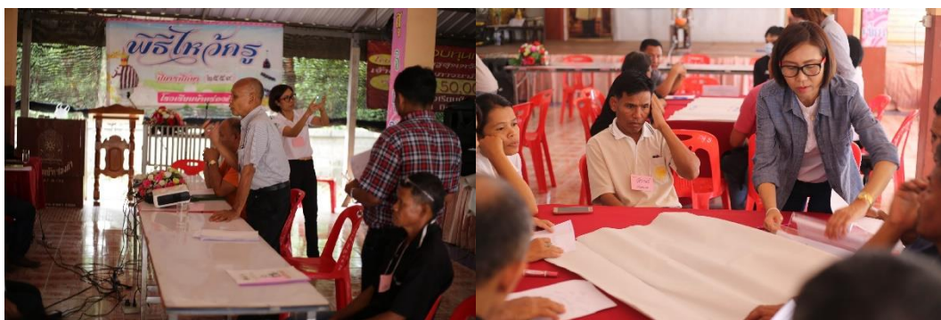
ภาพที่ 5.9 การแบ่งกลุ่มย่อยถอดบทเรียนและสรุปบทเรียนแนวปฏิบัติที่ดี

กิจกรรมที่ 5 ถอดบทเรียนและสรุปบทเรียนแนวปฏิบัติที่ดี แนวปฏิบัติที่ดีในการจัดการขยะ และรูปแบบการจัดการขยะที่เหมาะสม การใช้ประโยชน์จากขยะครัวเรือน