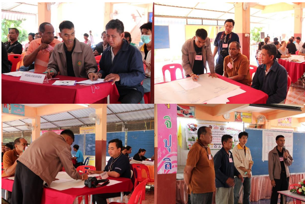
ภาพที่ 5.13 การนำเสนอข้อมูลวิธีการขั้นตอนการจัดการขยะตำบลแจนแลน อำเภอกุฉินารายณ์ จังหวัดกาฬสินธุ์