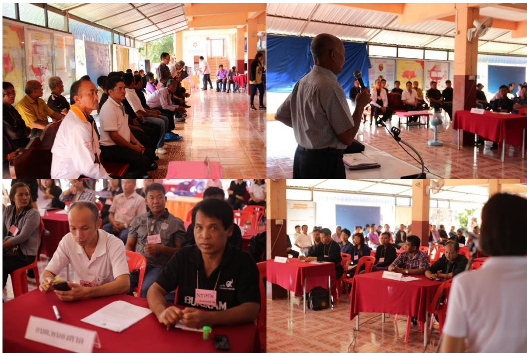
ภาพที่ 5.3 การบรรยายการคัดแยกขยะและการมีส่วนร่วมของคนในชุมชนในการจัดการขยะ

กิจกรรมที่ 1 เน้นการให้ความรู้พื้นฐานในการคัดแยกขยะ การมีส่วนร่วมของประชาชน ในการจัดการขยะลดการเกิดขยะตั้งแต่ต้นทาง โดยใช้หลัก 3Rs ร่วมมือกันทำให้ปริมาณขยะที่ต้องนำไปกำจัดลดลงเหลือน้อยที่สุดจนเป็นศูนย์