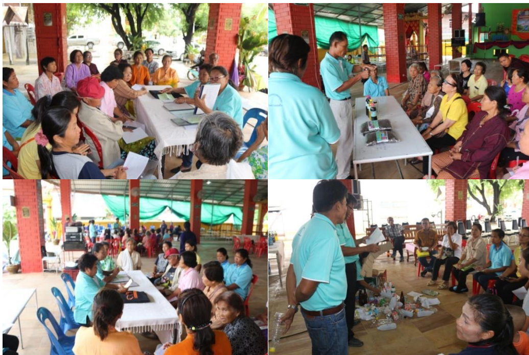
ภาพที่ 5.15 การอบรมให้ความรู้เพื่อลดขยะต้นทางในชุมชนหมู่ 6