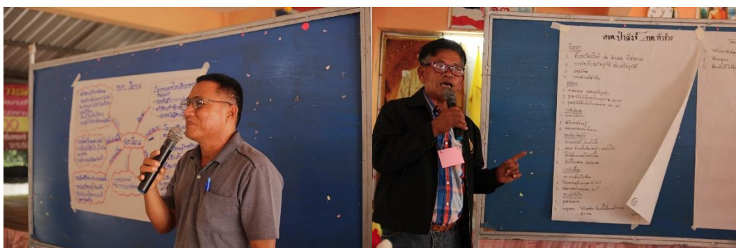
ภาพที่ 5.12 การนำเสนอแนวปฏิบัติที่ดีในการจัดการขยะ

กิจกรรมย่อย การนำเสนอแนวปฏิบัติที่ดี ในการจัดการชุมชน การจัดการขยะในชุมชน โดยการนำเสนอจะมี กฎกติกา การประชุมกลุ่ม การทำประชาคม การติดตามในการดำเนินการ ซึ่งเป็น การแลกเปลี่ยนเรียนรู้ซึ่งกันและกัน ถือได้ว่าเป็นแนวทางที่สามารถพัฒนาชุมชนในด้านการจัดการ ขยะได้เป็นอย่างดี