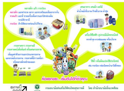
ภาพที่ 5.1 การให้ความรู้ในการคัดแยกขยะ