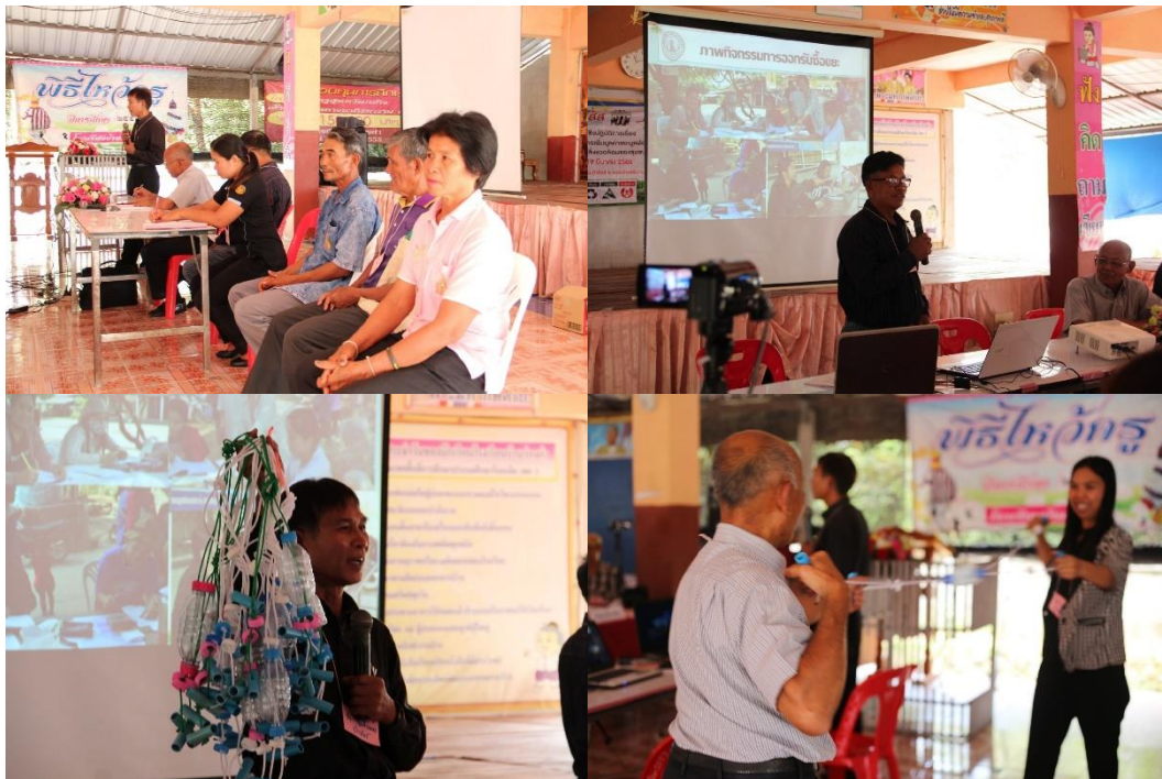
ภาพที่ 5.6 การสาธิตการออกกำลังการขยะรีไซเคิล

กิจกรรมที่ 3 แนวปฏิบัติในการจัดการขยะและการคัดแยกขยะในครัวเรือน โดย ต้นแบบ จาก อบต.ป่าสังข์ อ.จตุรพักตรพิมาน จ.ร้อยเอ็ด