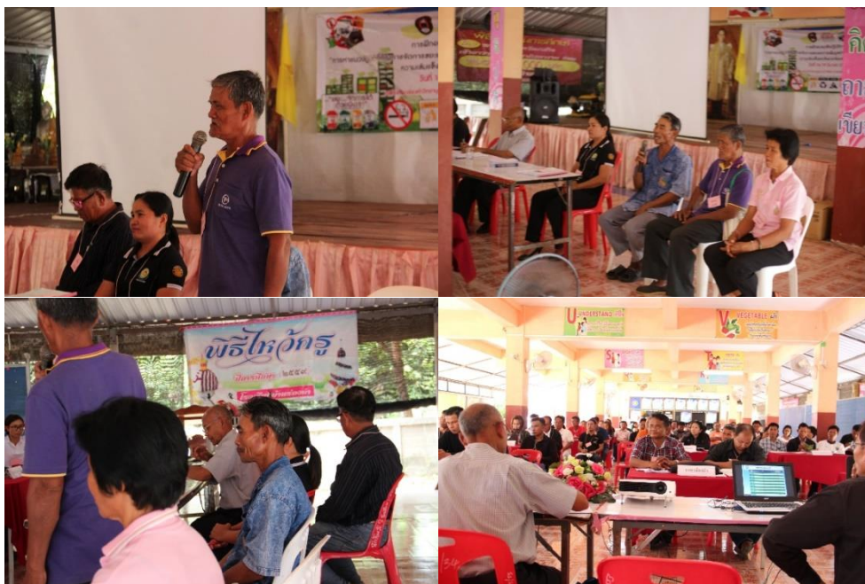
ภาพที่ 5.8 การสาธิตการแปรรูปปุ๋ยชีวภาพ ปุ๋ยหมักและปุ๋ยอัดเม็ดจากขยะอินทรีย์

กิจกรรมที่ 5 การแปรรูปปุ๋ยชีวภาพ ปุ๋ยหมักและปุ๋ยอัดเม็ดจากขยะอินทรีย์ โดย ต้นแบบ จาก อบต.ป่าสังข์ อ.จตุรพักตรพิมาน จ.ร้อยเอ็ด