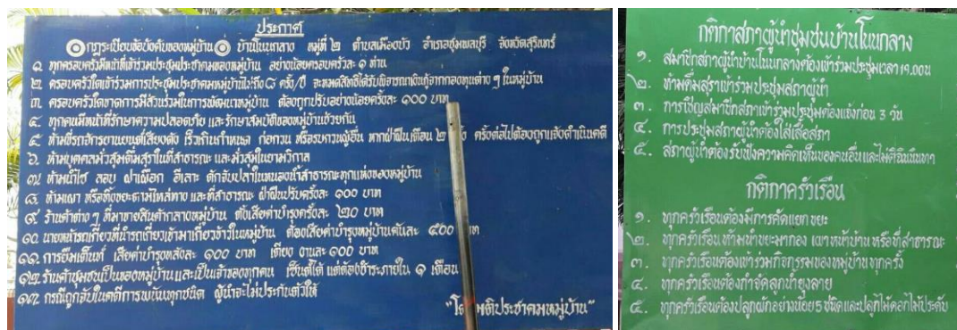
ภาพที่ 5.5 ประกาศตำบลเมืองบัว อำเภอชุมพลบุรี จังหวัดสุรินทร์

ตัวอย่าง ประกาศ และกติกาสภาผู้นำชุมชนโนนกลาง ตำบลเมืองบัว อำเภอชุมพลบุรี จังหวัดสุรินทร์ ได้ประกาศใช้ โดยได้รับความเห็นชอบจากคนในชุมชน