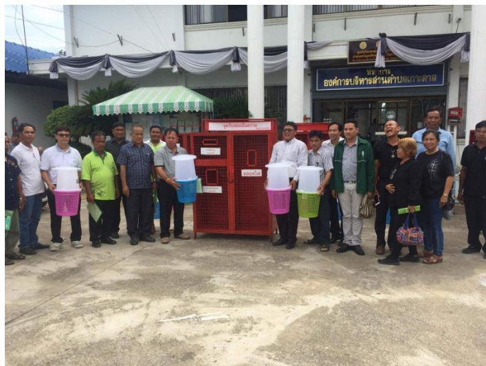
ภาพที่ 2-3 แสดงการลงพื้นที่การเก็บข้อมูล