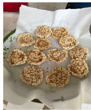
รูปภาพที่ 5.9 ปัญหาที่พบในการแปรรูปผลิตภัณฑ์