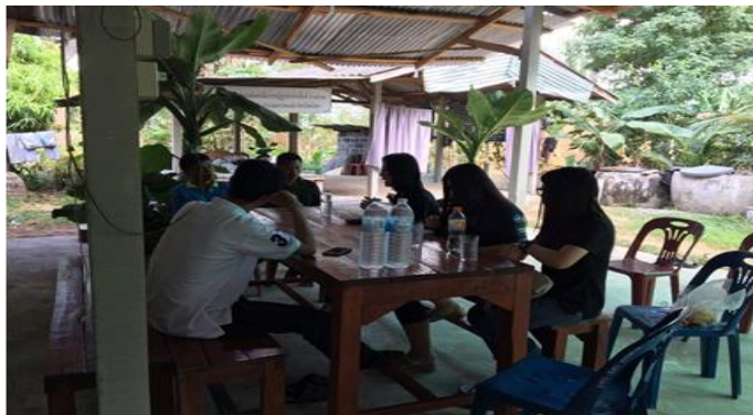
รูปภาพที่ 5.2 เตรียมพื้นที่ และเตรียมกลุ่มเป้าหมาย