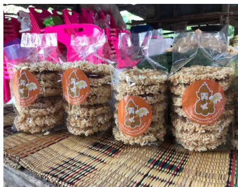
รูปภาพที่ 5.10 รูปผลิตภัณฑ์ที่เสร็จสมบูรณ์