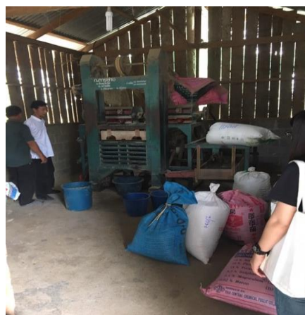
รูปภาพที่ 5.4 นักวิจัยได้ลงพื้นที่เพื่อศึกษาข้อมูลบริบทของชุมชน