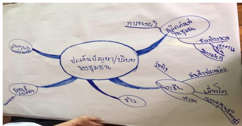
รูปภาพที่ 5.5 ประเด็นปัญหาที่เกิดขึ้นในชุมชน

จากการศึกษาปัญหาของชุมชน ทำให้ได้ประเด็นปัญหาดังต่อไปนี้ ดังรูปภาพที่ 5.5