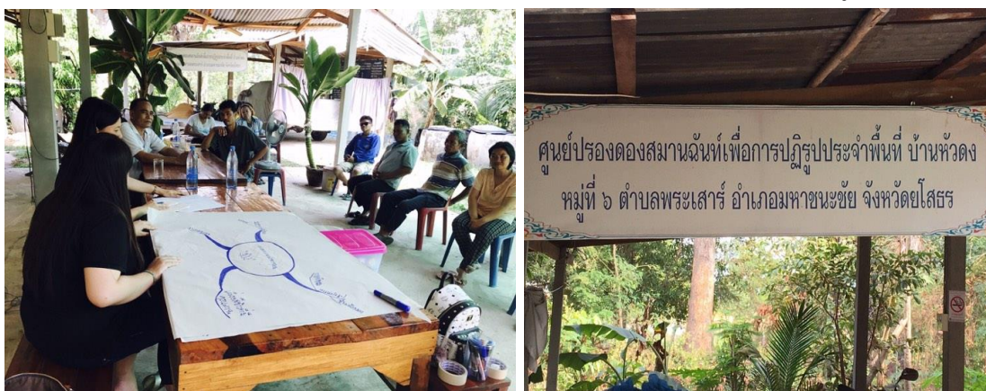
รูปภาพที่ 5.3 ประชุมชี้แจงเพื่อทำความเข้าใจโครงการกับกลุ่มชุมชน

รวมทั้งหาอาสาสมัครที่สนใจเข้าร่วมโครงการโดยสมัครใจ ดังรูปภาพที่ 5.3