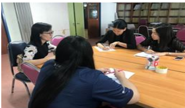
รูปภาพที่ 5.1 การประชุมวางแผนการดำเนินงาน

ในวันอังคารที่ 10 มกราคม 2560 ผู้วิจัยได้จัดประชุมระหว่างพี่เลี้ยง ทีมวิจัย และนักศึกษา โดยได้มีการวางแผนการดำเนินงานวิจัย ซึ่งในการประชุม ทีมวิจัยได้มีการกำหนดแผนการดำเนินงานในแต่ละขั้นตอนและในแต่ละกิจกรรม เพื่อให้การดำเนินงานเป็นไปตามวัตถุประสงค์ของการวิจัย มีการกำหนดวัน เวลา ในการลงพื้นที่วิจัย เพื่อเป็นการสร้างความเข้าใจให้กับคนในชุมชนถึงวัตถุประสงค์ของการวิจัย และการสร้างทีมวิจัยที่อยู่ในชุมชนเพื่อเป็นการหาเครือข่าย ร่วมทั้งการติดต่อประสานงานกับผู้มีส่วนเกี่ยวข้องทุกฝ่าย ดังรูปภาพที่ 5.1