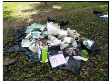
6) นำมูลฝอย 2 กองที่อยู่ด้านตรงกันข้ามที่เลือกไว้มา กองรวมกัน