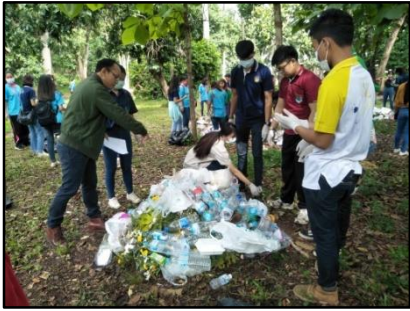
1) สุ่มตัวอย่างมูลฝอยจากกองมูลฝอย