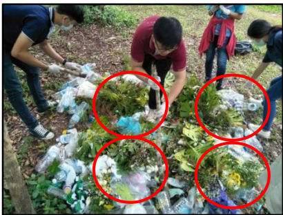
4) แบ่งมูลฝอยออกเป็น 4 ส่วนเท่าๆกัน