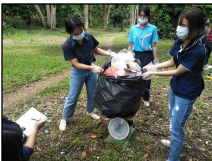
8) ทำการล้างและจัดบันทึกน้ำหนักของมูลฝอยแต่ละ ประเภท