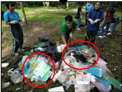
5) เลือก 2 กองที่อยู่ตรงกันข้าม