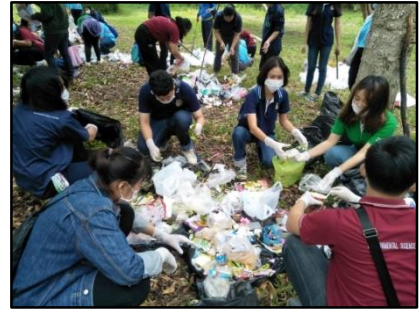
2) ฝึกมูลฝอยออกเป็นชั้นเล็กๆ