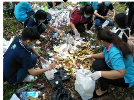
7) ทำการคัดแยกองค์ประกอบของมูลฝอย