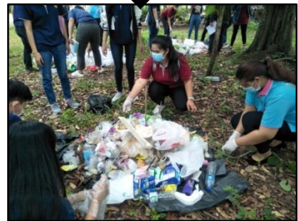
3) คลุกเคล้าให้เข้ากัน