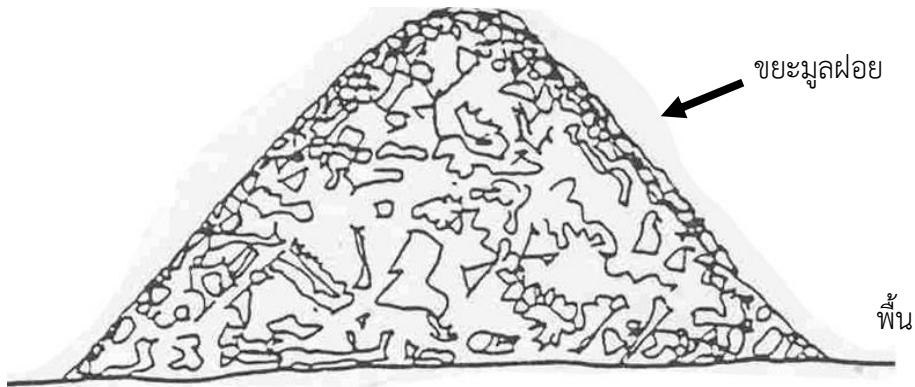
รูปที่ 3-1 ลักษณะการกองขยะให้เป็นรูปกรวยก่อนที่จะแบ่งขยะออกเป็น 4 ส่วน ที่มา : เสรีย์ ตู้อุประกาย, 2556 (อ้างถึงในพันชัย เม่นฉาย และคณะ, 2557)

5) คำนวณร้อยละขององค์ประกอบขยะมูลฝอยแต่ละประเภท จากสูตรดังนี้ องค์ประกอบของขยะแต่ละประเภท = \frac{\text{น้ำหนักขยะ}}{\text{น้ำหนักขยะรวม}} \times 100