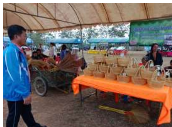
ภาพประกอบที่ 4.6 การนำเสนอผลิตภัณฑ์ชุมชนท้องถิ่นจากสมาชิกและชมรมผู้สูงอายุ พื้นที่ อบต.ผาเลือด

จากภาพที่ 4.5 และ 4.6 เป็นกิจกรรมมหกรรมสุขภาพ ซึ่ง อบต.ผาเลือดได้จัดกิจกรรมใน ตามแผนปฏิบัติราชการ โดยได้มีการให้ชมรมผู้สูงอายุในพื้นที่ร่วมดำเนินการขับเคลื่อนกิจกรรมทั้งใน ส่วนของการออกแบบรูปแบบกิจกรรม การทำกิจกรรม รวมทั้งการจัดพื้นที่ตลาดให้แก่ชมรมผู้สูงอายุ เพื่อใช้เป็นช่องทาง สถานที่ในการจำหน่ายผลิตภัณฑ์ของชุมชนโดยเฉพาะอย่างยิ่งผลิตภัณฑ์ของ ผู้สูงอายุ และเป็นการพิจารณาแนวทางในการส่งเสริมให้เกิดขึ้นที่ทางการตลาดสำหรับผลิตภัณฑ์ ผู้สูงอายุ และผลิตภัณฑ์ของชุมชนต่อไปในพื้นที่ขององค์การบริหารส่วนตำบลผาเลือด