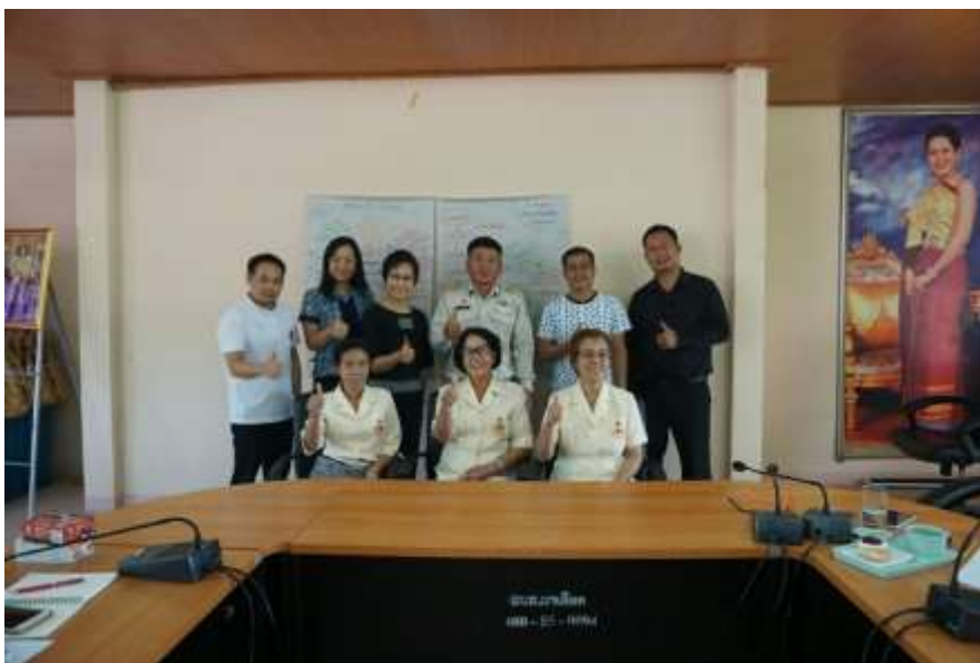
ภาพประกอบที่ 4.2 ผู้บริหารและตัวแทนชมรมผู้สูงอายุในพื้นที่ อบต.ผาเลือด ร่วมนำเสนอแนวทางการดำเนินงาน