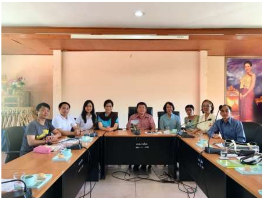
ภาพประกอบที่ 4.4 การเสวนาการสร้างความร่วมมือในการดำเนินกิจกรรม ระหว่างผู้สูงอายุกับ อบต.ผาเลือด

จากการดำเนินการจัดเวทีเสวนาเพื่อแสวงหาแนวทางความร่วมมือในการดำเนินกิจกรรมในการส่งเสริมคุณภาพชีวิตผู้สูงอายุระหว่างชมรมผู้สูงอายุในพื้นที่ อบต.ผาเลือด กับผู้บริหาร อบต.ผาเลือดนอกเหนือจากการดำเนินงานตามพันธกิจและแผนปฏิบัติราชการประจำปี ซึ่งเกิดการบูรณาการการทำงานร่วมกัน 4 ฝ่ายคือ อบต.ผาเลือด, ชมรมผู้สูงอายุ, ผู้นำชุมชน ท้องถิ่น และนักวิชาการจากทีมวิจัยของมหาวิทยาลัยนำไปสู่การกำหนดกิจกรรมนำร่องที่เสริมกับกิจกรรมหลักตามแผนปฏิบัติราชการประจำปี 2560 คือ กิจกรรม 3อ 2ส เพื่อส่งเสริมสุขภาพะ คุณภาพชีวิตของผู้สูงอายุ โดยมีการดำเนินกิจกรรมตามความต้องการของผู้สูงอายุในพื้นที่ ผู้นำชุมชนและประชาชนในท้องถิ่น รวมทั้งการนำเสนอข้อคิดเห็นจากภาควิชาการในการบูรณาการกิจกรรมเพื่อนำไปสู่การตอบสนองความต้องการ จึงเกิดแนวคิดการจัดแสดงสินค้าของผู้สูงอายุในชุมชนและการจำหน่ายสินค้าท้องถิ่นเพื่อเป็นการนำร่องก่อนนำผลการดำเนินงานไปประเมินและขยายผลสู่การสร้างพื้นที่ตลาดชุมชนซึ่งมีผู้สูงอายุเป็นกลไกหลักในการขับเคลื่อน