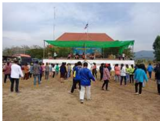
ภาพประกอบที่ 4.5 กิจกรรมมหกรรมสุขภาพ 3อ 2ส ประจำปี 2560 อบต.ผาเลือด