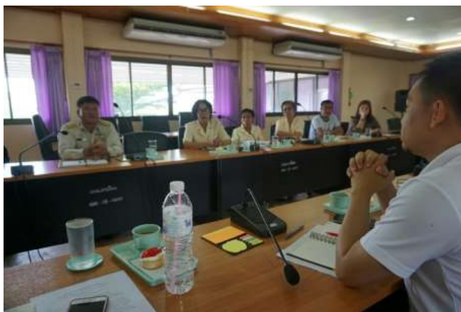
ภาพประกอบที่ 4.1 การนำเสนอความต้องการขอชมรมผู้สูงอายุในพื้นที่ อบต.ผาเลือด

ทั้งนี้ในการส่งเสริมทางด้านการตลาดสามารถดำเนินการได้โดยองค์การบริหารส่วนตำบลผาเลือด ซึ่งเป็นหน่วยงานองค์กรปกครองส่วนท้องถิ่นที่มีสถานที่ตั้งอยู่ในพื้นที่ติดกับเส้นทางหลัก ประกอบกับเป็นเส้นทางไปยังสถานที่ท่องเที่ยวคือเขื่อนสิริกิติ์ ดังนั้นจากการนำเสนอข้อมูลในเวทีเสวนาจึงมีการนำเสนอความต้องการที่สะท้อนไปยังองค์การบริหารส่วนตำบลผาเลือดเพื่อให้มีการส่งเสริมการจัดทำตลาดผู้สูงอายุในพื้นที่ของ อบต.โดยมีกลุ่มผู้สูงอายุเป็นผู้สนับสนุนและดำเนินการรวมทั้งจัดการดูแล