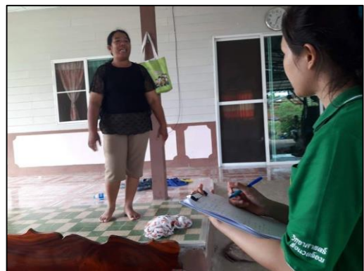
รูปที่ ๘-3 กิจกรรมการลงพื้นที่เก็บข้อมูลสำรวจภาคสนามเกี่ยวกับขยะในชุมชน (ต่อ)