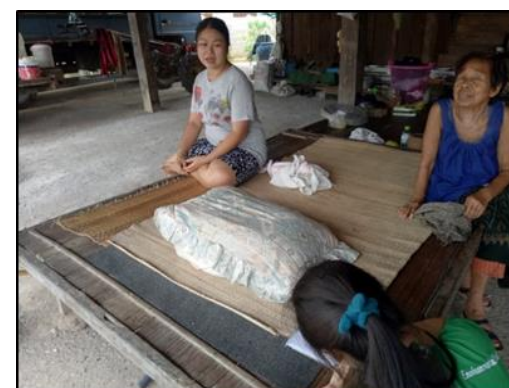
รูปที่ ผ-3 กิจกรรมการลงพื้นที่เก็บข้อมูลสำรวจภาคสนามเกี่ยวกับขยะในชุมชน