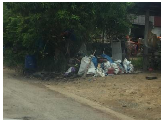
รูปที่ ผ-1 สภาพทั่วไปในการจัดการขยะของชุมชน