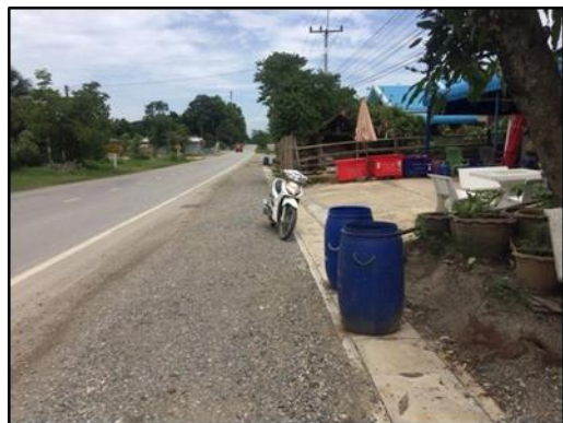
รูปที่ ผ-1 สภาพทั่วไปในการจัดการขยะของชุมชน (ต่อ)