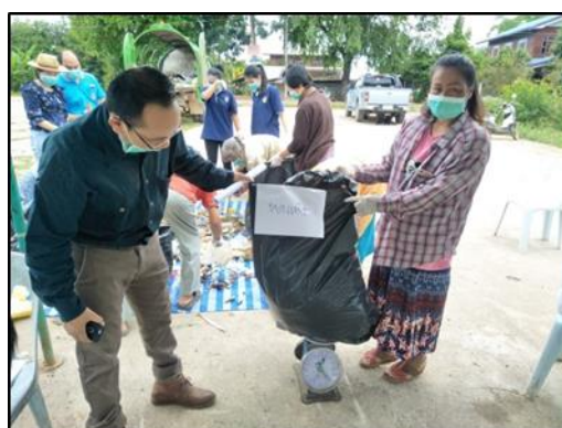
รูปที่ ๘-๒ กิจกรรมการสำรวจชนิด ปริมาณ และองค์ประกอบขยะมูลฝอย