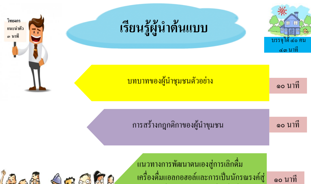
Flow chart แสดงกระบวนการเรียนรู้