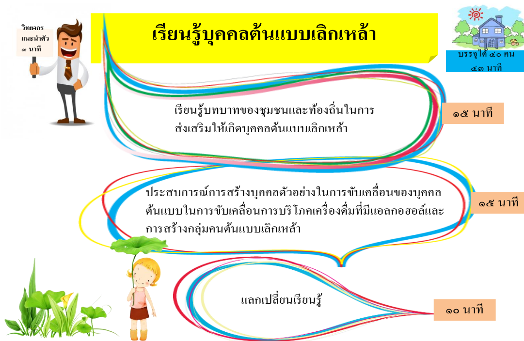
ภาพประกอบโดย องค์การบริหารส่วนตำบลนาเจริญ (2560)