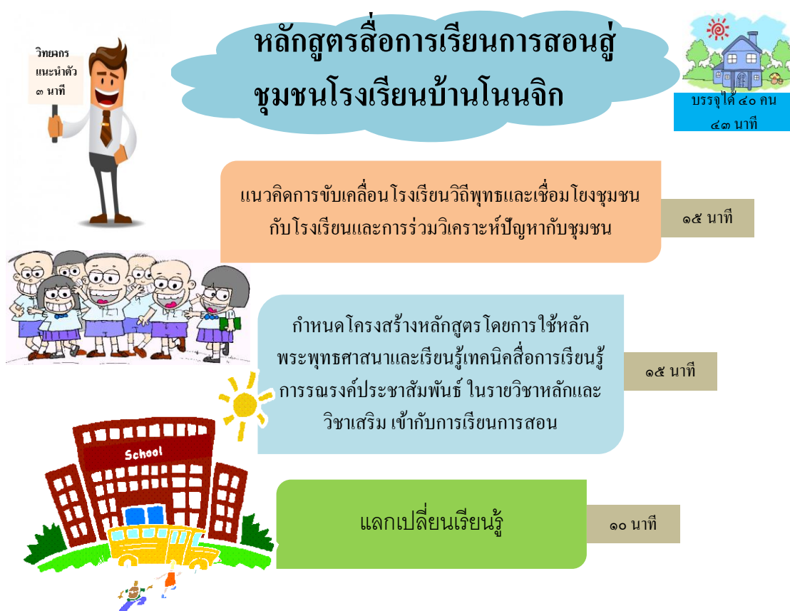
ภาพประกอบโดย องค์การบริหารส่วนตำบลนาเจริญ (2560)

หลักสูตรวิชาการเสริมสร้างศักยภาพให้กับเด็กเยาวชนและครอบครัว : โรงเรียนวิถีพุทธ