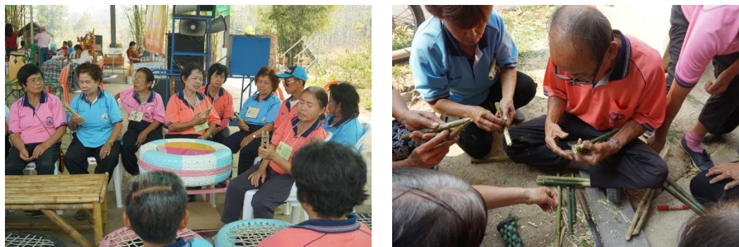
ภาพที่ 5 ผู้สูงอายุทดลองสาธิตการใช้อุปกรณ์ออกกำลังกายที่ประดิษฐ์ขึ้นเอง