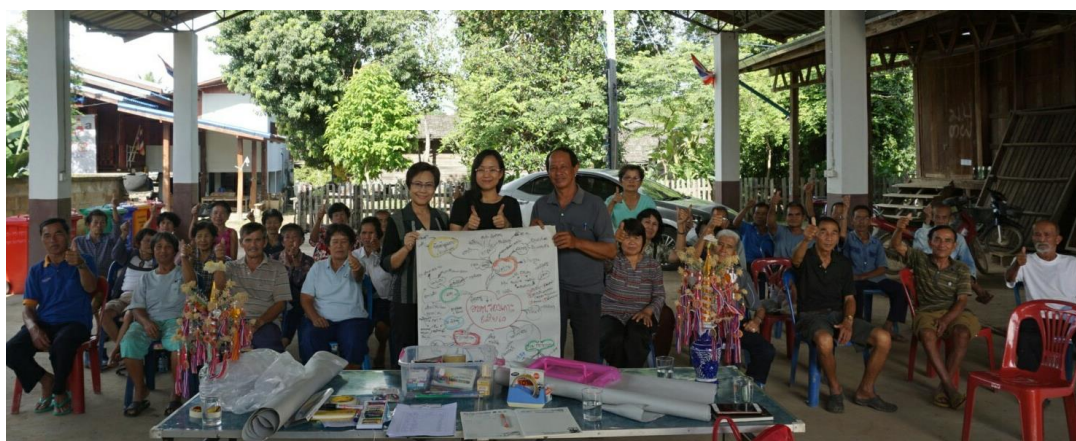
ภาพที่ 2 การดำเนินกิจกรรมเวทีเสวนาเพื่อการวิเคราะห์ข้อมูลและศักยภาพผู้สูงอายุ ต.ร่องเคาะ

ในขณะที่ประเด็นความต้องการของผู้สูงอายุเพื่อนำไปสู่การสร้างเสริมสุขภาพของผู้สูงอายุเพื่อนำไปสู่การขยายผลเชิงกิจกรรมตามวัตถุประสงค์การวิจัยนั้น ในเวทีเสวนาได้สะท้อนข้อมูลความต้องการของผู้สูงอายุสามารถแบ่งออกเป็นความต้องการ 3 ด้าน ได้แก่ (1) ความต้องการด้านสุขภาพ เช่น เครื่องออกกำลังกาย เป็นต้น (2) ความต้องการด้านรายได้และอาชีพ และ (3) ความต้องการด้านกิจกรรมในโรงเรียนผู้สูงอายุ เช่น การออกกำลังกาย การสวดมนต์ เป็นต้น