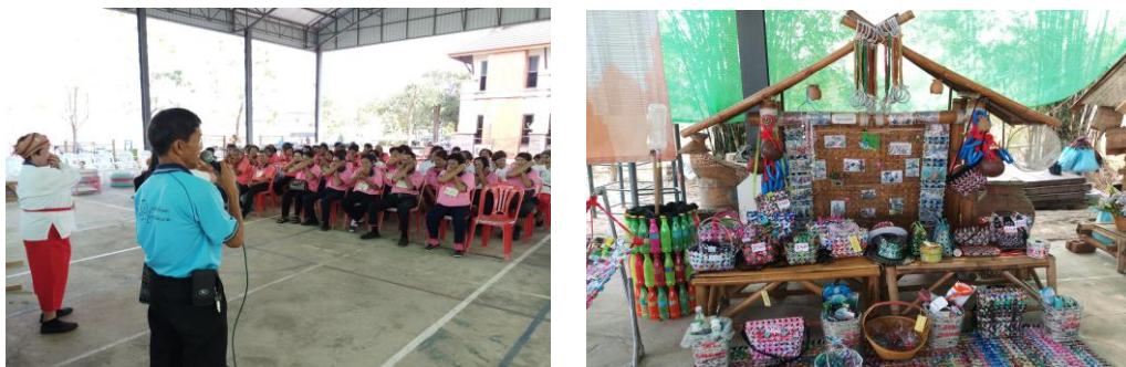
ภาพที่ 3 กิจกรรมการสร้างการเรียนรู้ด้านสุขภาพสำหรับผู้สูงอายุ และผลิตภัณฑ์ของผู้สูงอายุจากวัสดุเหลือใช้