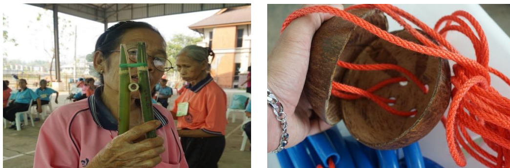
ภาพที่ 6 อุปกรณ์การออกกำลังกายที่ผู้สูงอายุประดิษฐ์ขึ้นจากวัสดุที่หาได้ในชุมชน