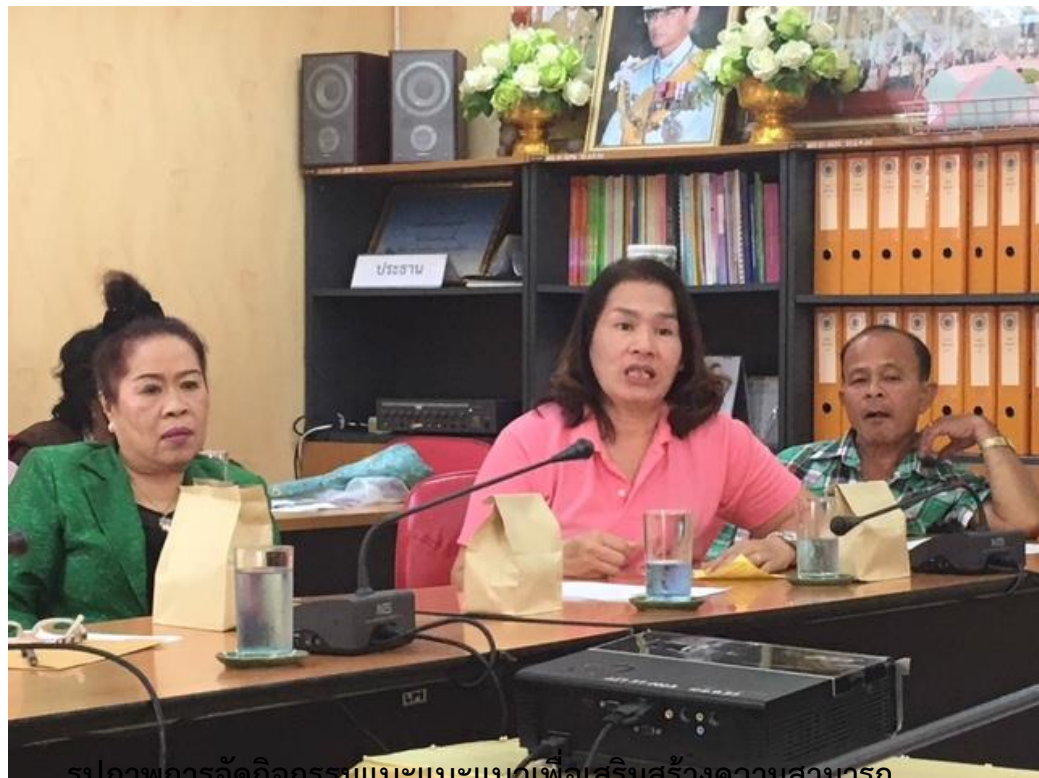
รูปภาพการจัดกิจกรรมแนะแนวเพื่อเสริมสร้างความสามารถ