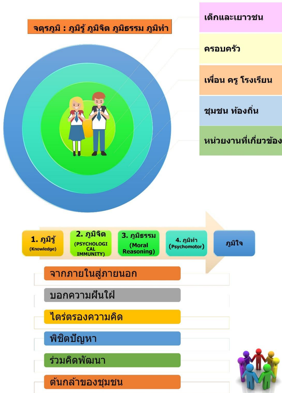
ภาพที่ 8 การจัดกิจกรรมการเรียนรู้เพื่อสร้างภูมิคุ้มกันของเด็กและเยาวชนต้นแบบ

หลังจากนั้นจึงนำข้อมูลที่ได้ศึกษาได้จากแนวคิดทฤษฎีและกระบวนการมีส่วนร่วมมาสังเคราะห์เพื่อวางแผนการจัดกิจกรรมการเรียนรู้เพื่อสร้างภูมิคุ้มกันทางสังคมอย่างมีส่วนร่วม ดังภาพที่ 8