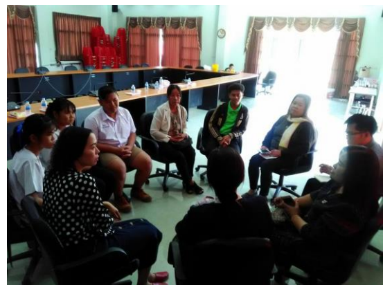
ภาพที่ 5 การสนทนากลุ่ม

จากภาพที่ 5 การสัมภาษณ์แบบไม่มีโครงสร้างด้วยการสนทนากลุ่ม พบประเด็นปัญหาที่เกี่ยวข้องเชื่อมโยงกันใน 3 ด้าน ดังนี้