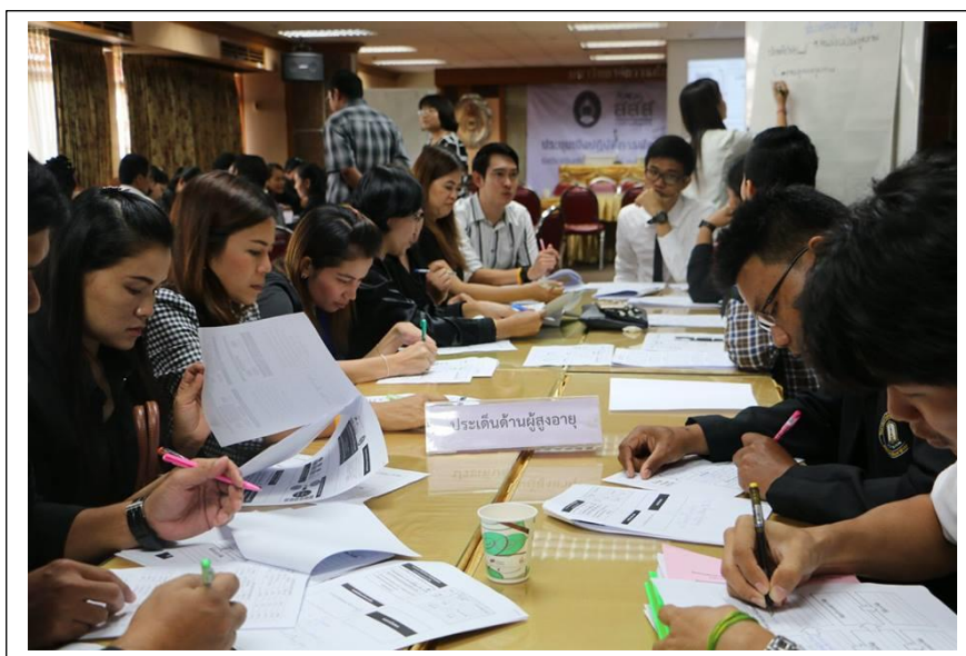
ภาพ 1.1 แสดงตัวแทนอบต.บ้านไทยนำเสนอปัญหาความต้องการผ่านการประชุมเชิงปฏิบัติการ ณ ห้องประชุมพุทธรักษา ชั้น 3 อาคารเฉลิมพระเกียรติ 50 พรรษามหาวชิราลงกรณ มรภ.บุรีรัมย์ (ที่มา : วันที่ 25 พฤศจิกายน 2559)

โดยการถ่ายทอดภูมิความรู้ ประสบการณ์ที่สั่งสม แก่บุคคลอื่นเพื่อสืบสานภูมิปัญญาให้คงคุณค่าคู่กับชุมชน ตำบลบ้านไทย อำเภอเชียงใน จังหวัดอุบลราชธานีเป็นพื้นที่หนึ่งที่มีความต้องการในการพัฒนาส่งเสริมสุขภาพะด้านสังคมที่เหมาะสมของผู้สูงอายุ พื้นที่ตำบลบ้านไทย (ที่มา : ตัวแทน อบต.บ้านไทยนำเสนอปัญหาความต้องการผ่านการประชุมเชิงปฏิบัติการ ภายใต้โครงการวิจัยและพัฒนาเพื่อเสริมสร้างความเข้มแข็งในการจัดการตนเองของชุมชนท้องถิ่น ร่วมกับ อปท.เครือข่าย (ครั้งที่ 2) เมื่อวันที่ 25 พฤศจิกายน 2559 ณ ห้องประชุมพุทธรักษา ชั้น 3 อาคารเฉลิมพระเกียรติ 50 พรรษามหาวชิราลงกรณ มหาวิทยาลัยราชภัฏบุรีรัมย์)