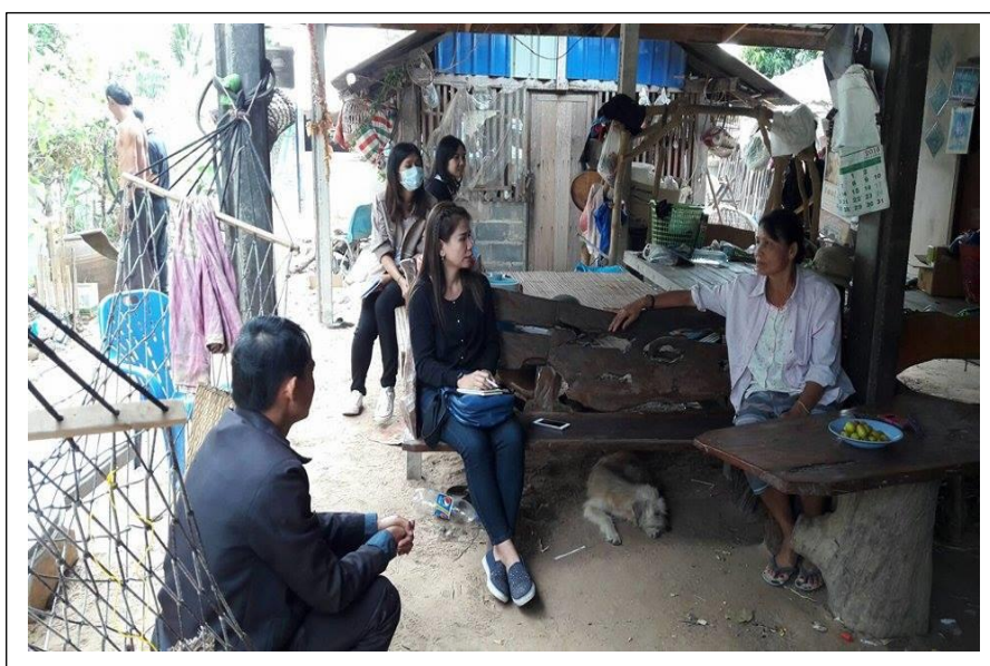
ภาพ 1.2,1.3 แสดงคณะผู้วิจัยได้ลงพื้นที่เขตตำบลบ้านไทยเก็บรวบรวมข้อมูลบริบทตำบลเบื้องต้น ณ เขตพื้นที่ตำบลบ้านไทย อำเภอลำทะเมนชัย จังหวัดนครราชสีมา (ที่มา : วันที่ 27 ธันวาคม 2559)