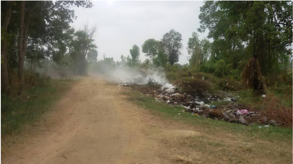
ภาพที่ 5.13 ภาพแสดงสภาพการเผาขยะในพื้นที่หมู่บ้านเมืองไผ่ หมู่ 4 ต.เมืองบัว