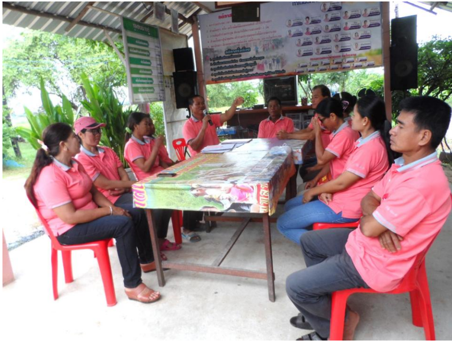
ภาพที่ 5.10 ภาพกิจกรรมการประชุมกรรมการคุ้ม หมู่บ้านโนนกลาง หมู่ 2 ต.เมืองบัว