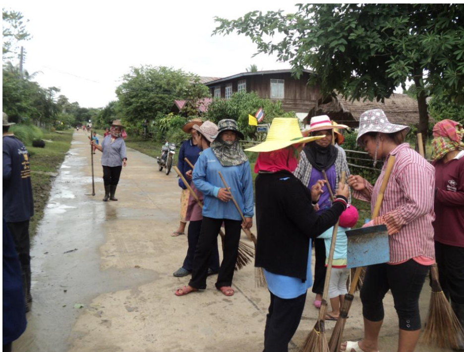
ภาพที่ 5.11 ภาพกิจกรรมการพัฒนาชุมชน หมู่บ้านโนนกลาง หมู่ 2 ต.เมืองบัว