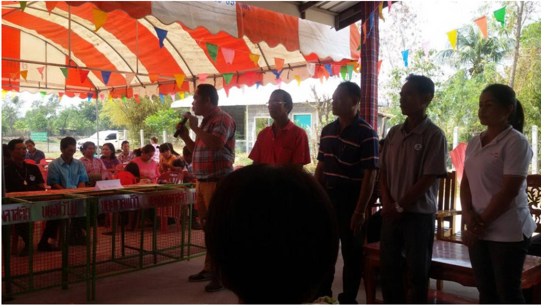
ภาพที่ 5.15 ภาพแสดงกิจกรรมผ้าป่าขยະ หมู่บ้านเมืองไผ่ หมู่ 4 ต.เมืองบัว