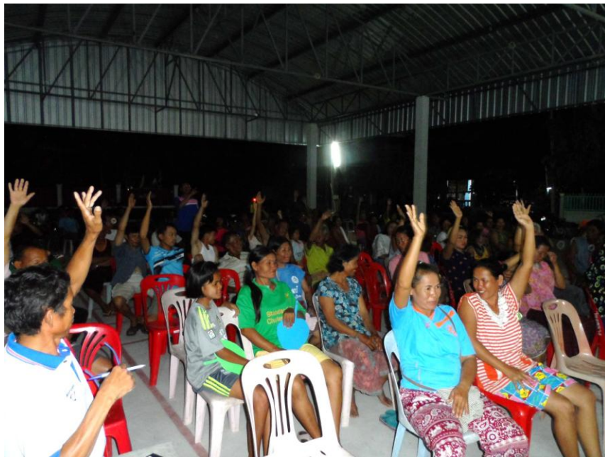
ภาพที่ 5.3 ภาพการประชุมประชาคมหมู่บ้านโนนกลาง หมู่ 2 ต.เมืองบัว