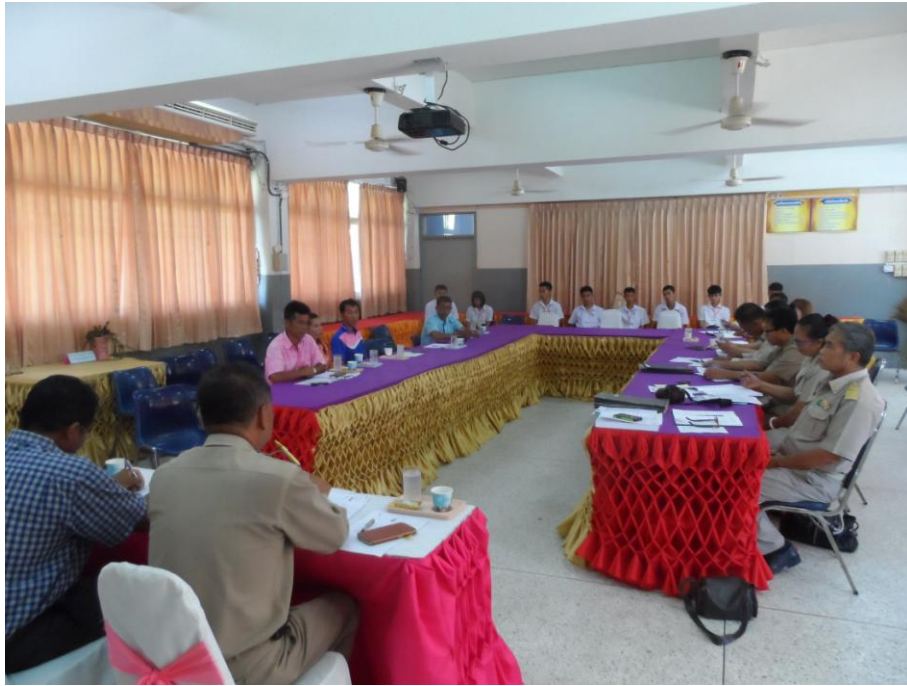
ภาพที่ 5.6 ภาพกิจกรรมพบปะภาคีเครือข่ายโรงเรียน หมู่บ้านโนนกลาง หมู่ 2 ต.เมืองบัว