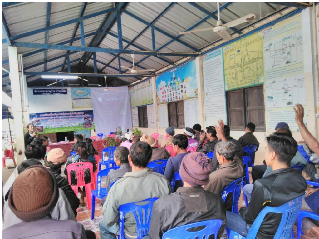
ภาพที่ 5.14 ภาพแสดงกิจกรรมการอบรมความรู้เรื่องเชื้อเพลิงจากขยะอินทรีย์ หมู่บ้านเมืองไผ่ หมู่ 4 ต.เมืองบัว