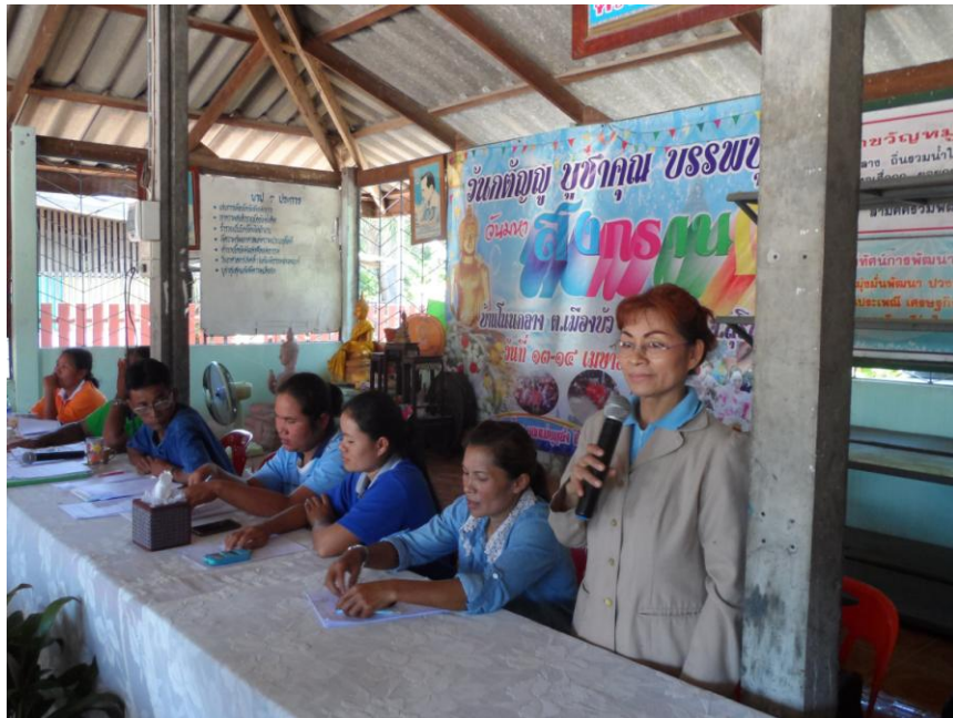
ภาพที่ 5.4 ภาพการประชุมจัดตั้งสภาผู้นำชุมชนหมู่บ้านโนนกลาง หมู่ 2 ต.เมืองบัว