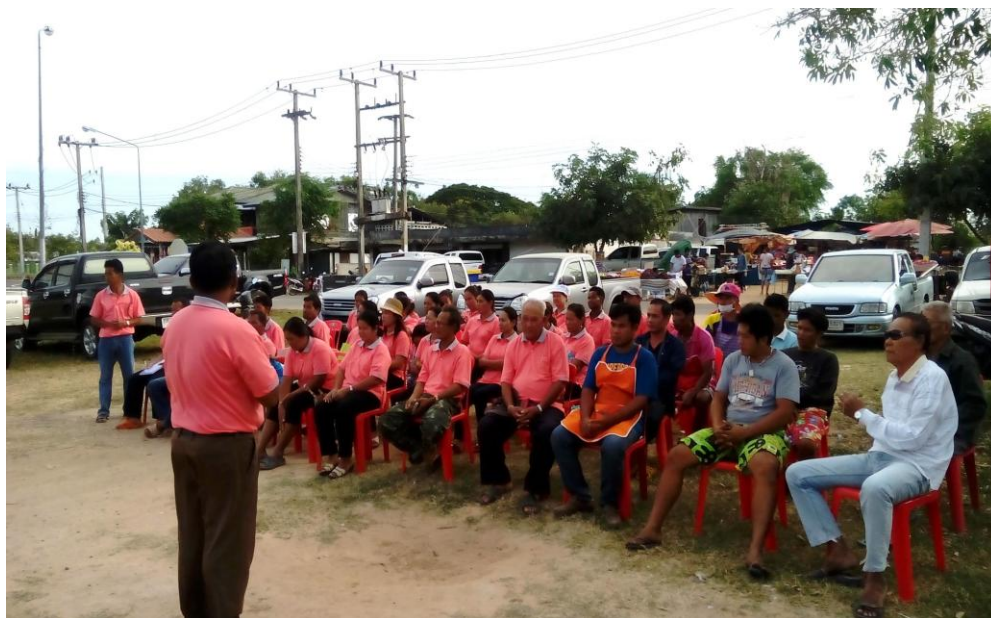
ภาพที่ 5.8 ภาพกิจกรรมพบปะเครือข่ายผู้ประกอบการตลาดนัด หมู่บ้านโนนกลาง หมู่ 2 ต.เมืองบัว