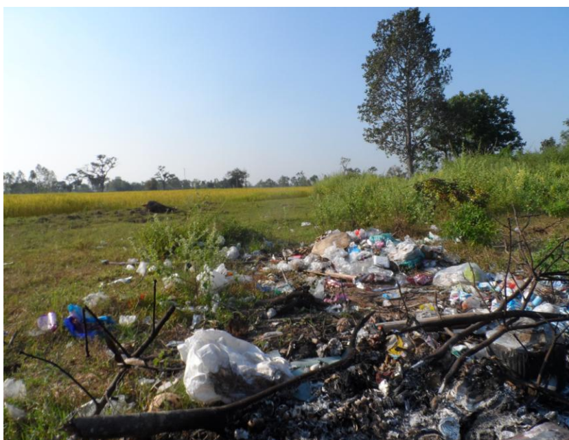
ภาพที่ 5.1 สภาพปัญหาขยะที่หมู่บ้านโนนกลาง หมู่ 2 ต.เมืองบัว

(5) การสร้างกฎ กติกา และกลไกชุมชนเพื่อให้เกิดการขับเคลื่อนและนำสู่ผลการปฏิบัติงานจัดการขยะที่ดีและเหมาะสมสำหรับพื้นที่ พบว่าชุมชนหมู่บ้านโนนกลาง หมู่ที่ 2 มีการดำเนินการชัดเจนและสามารถถือเป็นแนวปฏิบัติที่ดีได้ โดยมีหลักการที่สรุปได้คือ การให้สมาชิกในชุมชนมีส่วนร่วมในการสร้างกฎ กติกา และกลไกชุมชนเอง มีการตรวจสอบกันเองภายในระหว่างตัวแทนแต่ละคุ้มในหมู่บ้าน มีการจัดประชุมปรึกษาหารือกันอย่างต่อเนื่องโดยอาศัยกฎและกติกาที่ตกลงกัน ซึ่งจากความเข้มแข็งของกลไกชุมชนหรือผู้นำระดับชุมชนดังกล่าว ทำให้หมู่บ้านโนนกลาง หมู่ที่ 2 สามารถขับเคลื่อนกิจกรรมในลักษณะต่างๆ ได้มาก นอกจากนี้ยังมีการสร้างเครือข่ายกับหน่วยงานอื่นทั้งภายในพื้นที่เช่น โรงเรียน สถานีอนามัย เป็นต้น และเครือข่ายภายนอก เช่น สำนักงานสิ่งแวดล้อมจังหวัดสุรินทร์ สสส. เป็นต้น อันเป็นการสร้างโอกาสให้กับพื้นที่เป็นอย่างมาก ส่งผลให้พื้นที่เป็นแหล่งเรียนรู้หรือศึกษาดูงานของพื้นที่อื่นจากภายนอก รวมถึงเป็นการกระตุ้นเศรษฐกิจในชุมชน สร้างรายได้ให้กับสมาชิกในชุมชน รวมถึงเป็นการสร้างเสริมองค์ความรู้ให้กับคนในชุมชนโดยการสร้างโอกาสการแลกเปลี่ยนเรียนรู้กับทั้งสมาชิกในชุมชนเองและผู้ที่มาศึกษาดูงานจากภายนอก ทั้งนี้องค์การบริหารส่วนตำบลเมืองบัวได้มีการวางนโยบาย ผลักดัน และขับเคลื่อนให้หมู่บ้านอื่นๆ ได้มีโอกาสเข้ามาแลกเปลี่ยนเรียนรู้กับหมู่บ้านโนนกลาง หมู่ที่ 2 เพื่อให้เกิดการพัฒนาพื้นที่อื่นๆ ต่อไป