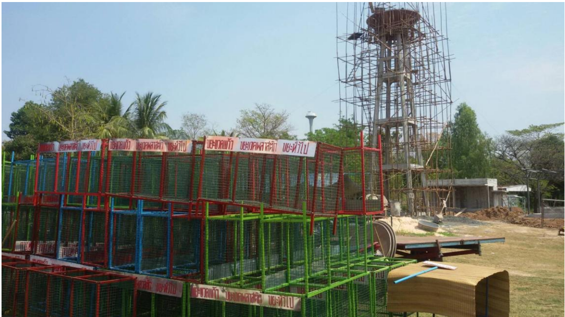
ภาพที่ 5.16 ภาพแสดงกิจกรรมการแจกถังคัดแยกขยะ หมู่บ้านเมืองไผ่ หมู่ 4 ต.เมืองบัว