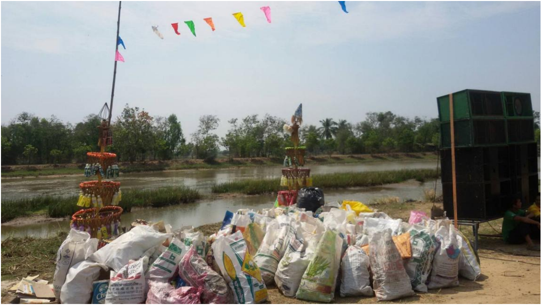
ภาพที่ 5.17 ภาพแสดงกิจกรรมผ้าป่าขยะ หมู่บ้านเมืองไผ่ หมู่ 4 ต.เมืองบัว