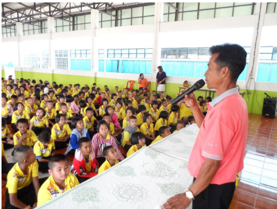
ภาพที่ 5.7 ภาพกิจกรรมพบปะภาคีเครือข่ายโรงเรียน หมู่บ้านโนนกลาง หมู่ 2 ต.เมืองบัว