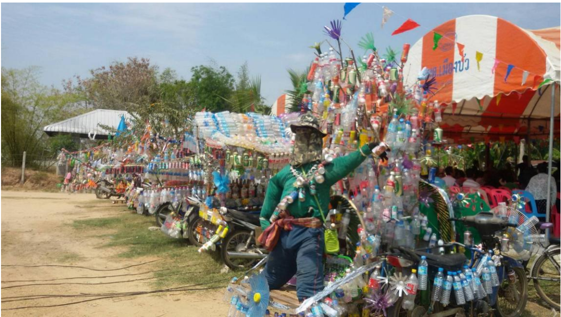
ภาพที่ 5.18 ภาพแสดงกิจกรรมขบวนแห่ผ้าป่าขยะ หมู่บ้านเมืองไผ่ หมู่ 4 ต.เมืองบัว