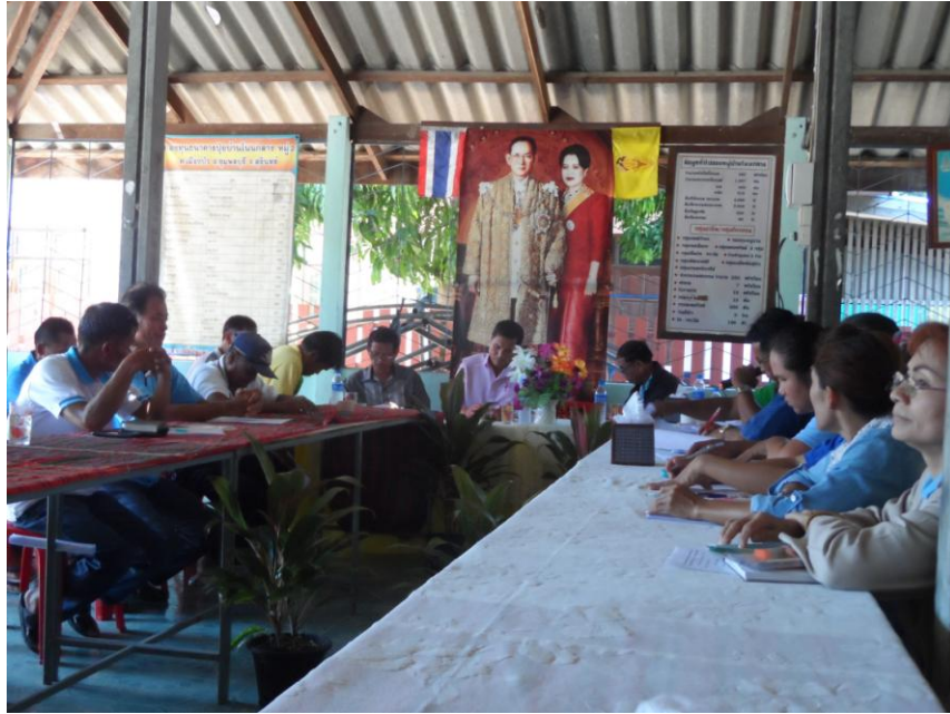
ภาพที่ 5.2 ภาพการประชุมคณะกรรมการหมู่บ้านโนนกลาง หมู่ 2 ต.เมืองบัว