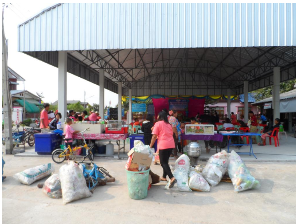
ภาพที่ 5.9 ภาพกิจกรรมตลาดนัด ผู้ซื้อพบผู้ขาย หมู่บ้านโนนกลาง หมู่ 2 ต.เมืองบัว