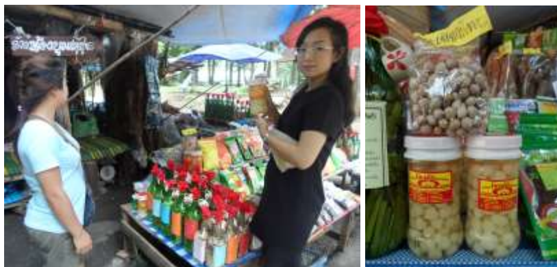
ภาพประกอบที่ 4.5 ผลิตภัณฑ์กระเทียมแปรรูปจากต่างถิ่นที่นำเข้ามาจำหน่ายในพื้นที่