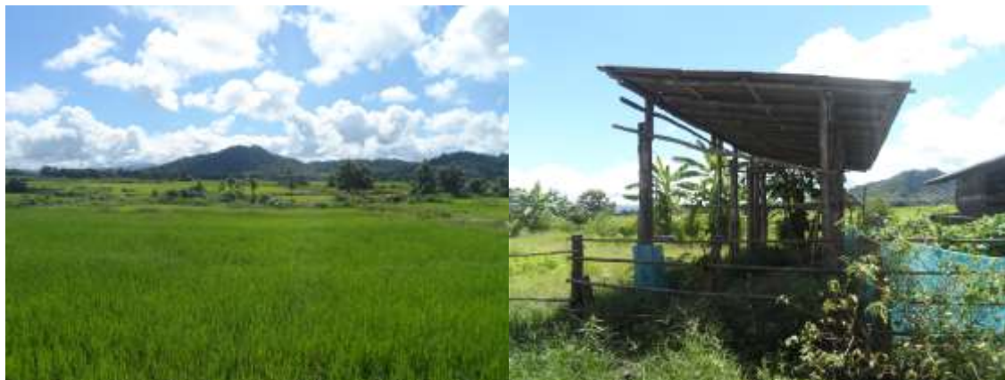
ภาพประกอบที่ 4.1 แปลงนาและโรงเก็บกระเทียมช่วงที่ยังไม่มีการเพาะปลูก

ทั้งนี้หากเกษตรกรรายใดที่มีที่นาสำหรับการเพาะปลูกอีกก็จะมี การเพาะปลูกข้าวเพื่อนำไปจำหน่าย โดยมีพฤติกรรมต่างๆ ไม่ต่างไปจากเกษตรกรทั่วไปคือ เริ่มมีการใช้เครื่องทุ่นแรงในการเพาะปลูกเพิ่มมากขึ้น มีการใช้สารเคมีเข้ามาช่วยในกระบวนการผลิต การใช้ปุ๋ยเคมีในการเพาะปลูก และการจำหน่ายให้แก่พ่อค้าคนกลางหรือโรงสีทั่วไปตามราคาที่เสนอโดยพ่อค้าคนกลางหรือที่เรียกว่าราคาในท้องตลาด นอกฤดูทำนา เกษตรกรในพื้นที่จะมีการเพาะปลูกพืชไร่พืชสวนซึ่งส่วนใหญ่ในพื้นที่ทั้งหมดมักจะปลูกกระเทียมหรือกระเทียมอันเนื่องจากพื้นที่ทางการเกษตรของชุมชนในเขตเทศบาลตำบลหลวงใต้หรือแม้กระทั่งในพื้นที่ต่างๆ ของตำบลหลวงใต้ เป็นพื้นที่ชุ่มน้ำคือมีแม่น้ำหลักและแม่น้ำสาขาไหลผ่าน รวมทั้งในบางพื้นที่ก็มีน้ำหลากจากภูเขาในบางฤดู ดังนั้นเกษตรกรจึงมีการปรับปรุงและเปลี่ยนแปลงการเพาะปลูกพืชสวนพืชไร่จนมีการปลูกกระเทียมหรือกระเทียมในปัจจุบัน และในพื้นที่บ้านของประชาชนในพื้นที่เกือบทุกหลังคาเรือนจะมีอาคารหรือพื้นที่สำหรับการเก็บรักษากระเทียมภายหลังการเก็บเกี่ยวอยู่เกือบทุกหลังคาเรือนเนื่องจากจำนวนผลผลิตในแต่ละปีมีจำนวนมาก บางหลังจะมีการนำมาแขวนไว้เพื่อให้กระเทียมแห้งหรือเก็บไว้จนคิดว่าราคาที่จะขายจะได้กำไร