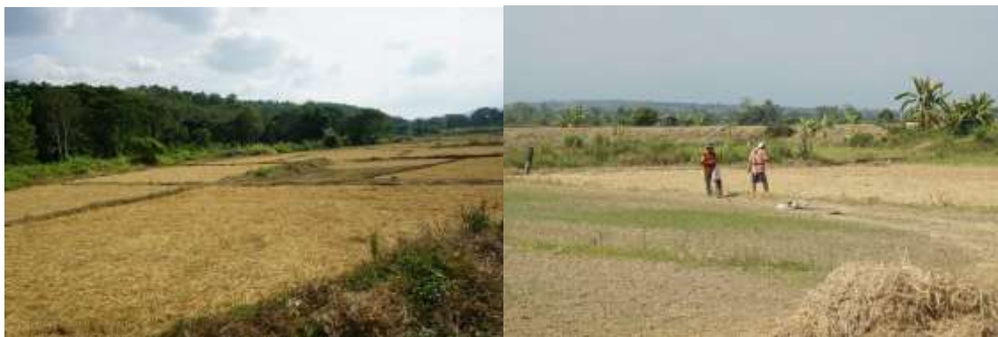
ภาพประกอบที่ 4.2 พื้นที่เพาะปลูกกระเทียมหลังจากเก็บเกี่ยวข้าว