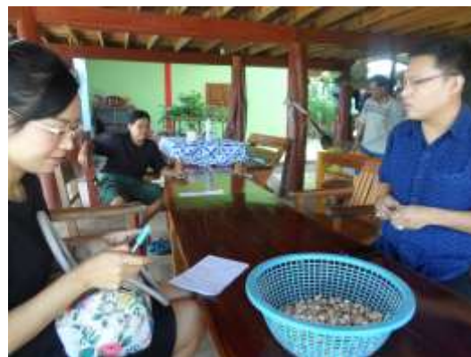
ภาพประกอบที่ 4.4 ทีมนักวิจัยลงพื้นที่ศึกษาการดำเนินงานของกลุ่มวิสาหกิจชุมชนเกษตรกรผู้ปลูกกระเทียม โดยมีนายกเทศมนตรีตำบลหลวงใต้ร่วมให้ข้อมูล