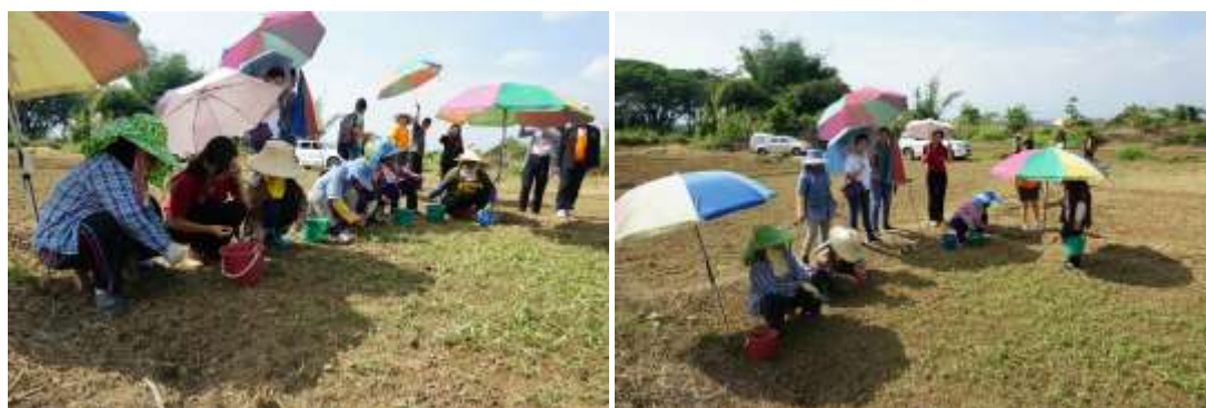
ภาพประกอบที่ 4.3 ทีมนักวิจัยลงพื้นที่สำรวจแปลงนาและการเพาะปลูกกระเทียม ในพื้นที่ ทต.หลวงใต้