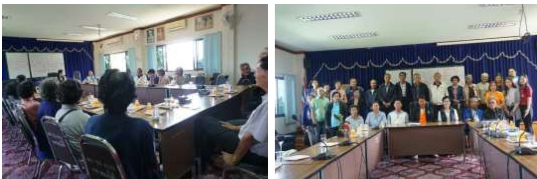
ภาพประกอบที่ 4.6 เวทีวิเคราะห์ปัญหาและแนวทางแก้ไขทางด้านการเกษตร

จากศักยภาพทางภูมิปัญญาดั้งเดิมของคนในชุมชนและจำนวนผลผลิตกระเทียม คุณลักษณะของกระเทียมโทนที่มีจำนวนมาก ทำให้เกิดจุดเด่นของชุมชนในการนำไปสู่การพัฒนาผลิตภัณฑ์ของกระเทียมเพื่อสร้างผลผลิตทางการเกษตรขึ้นมา รวมทั้งความต้องการในการบริโภคกระเทียมแปรรูป โดยเฉพาะอย่างยิ่งจากผู้ประกอบการร้านก๋วยเตี๋ยวทั้งในพื้นที่และนอกพื้นที่จากการสอบถามและศึกษาจากผู้ประกอบการพบว่า ยังไม่มีสินค้าแปรรูปจากกระเทียมที่อยู่ในพื้นที่ในจำหน่ายเพื่อเป็นเครื่องปรุงแต่อย่างใด รวมทั้งความต้องการของร้านที่มีต่อกระเทียมเจียวหรือกากหมู ยังมีความต้องการจำนวนมากและต่อเนื่อง รวมทั้งร้านขายของฝากของที่ระลึกที่จำหน่ายกระเทียมโทนต้องให้ข้อมูลถึงความต้องการของลูกค้าพบว่า ลูกค้ามีความต้องการสูงเนื่องจากสามารถนำไปเป็นของที่ระลึกได้ และกระเทียมโทนมีเอกลักษณ์ของรสชาติที่แตกต่างจากกระเทียมทั่วไป ดังนั้นจึงทำให้ราคากระเทียมโทนต้องสูงกว่ากระเทียมดองทั่วไป ทั้งนี้แนวทางการพัฒนาผลิตภัณฑ์จากปัญหาอุปสรรคจุดอ่อนและจุดแข็ง จุดอ่อนของเกษตรกรผู้ปลูกกระเทียมกระเทียม และกลุ่มวิสาหกิจชุมชนเกษตรกรผู้ปลูกกระเทียมในพื้นที่ชุมชนหลวงใต้ อ.จาว จ.ลำปาง สามารถนำเสนอเป็นโมเดลการพัฒนาผลิตภัณฑ์ดังภาพประกอบที่ 4.7 ดังต่อไปนี้