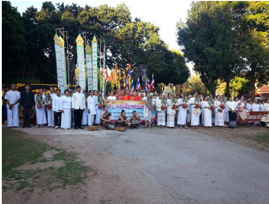
ภาพที่ 2 แสดงการเข้าร่วมกิจกรรมเครือข่ายของผู้สูงอายุเทศบาลชาติในงานวันเข้าพรรษา ณ วัดป่าไม้แดง พระเจ้าพรหมมหาราช