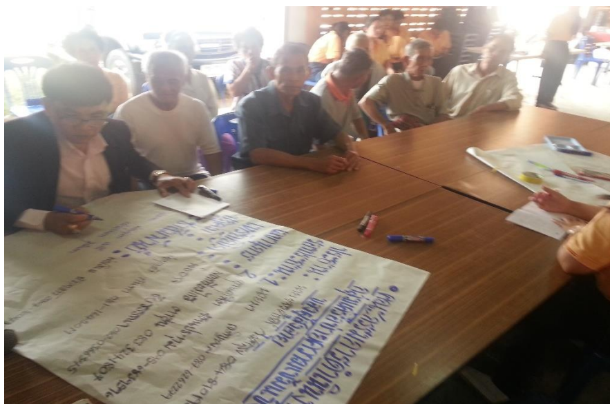
ภาพที่ 1 แสดงกิจกรรมการแบบมีส่วนร่วมของกลุ่มผู้สูงอายุตำบลหนองบัว เพื่อวางแผนดำเนินกิจกรรมส่งเสริมสุขภาพ