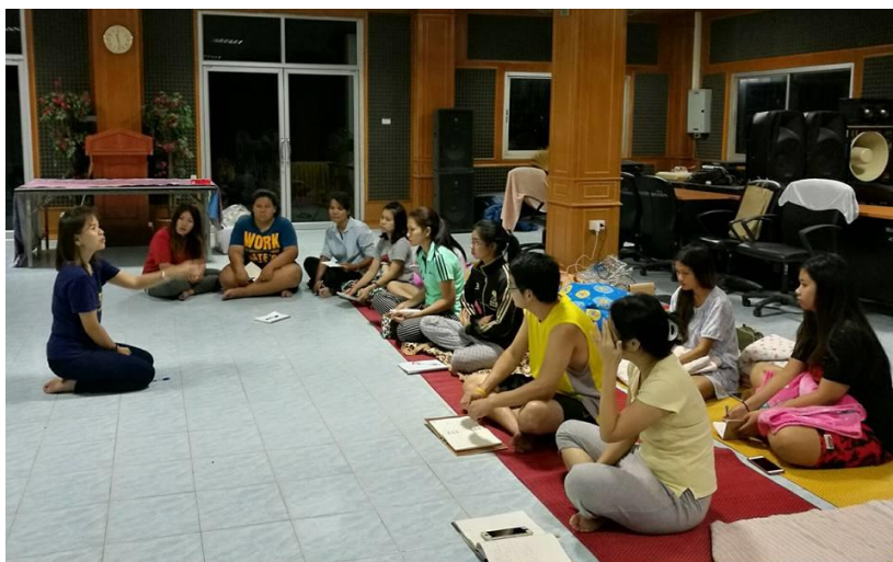
ภาพที่ 2 ประชุมทีมทำงานวิจัย (นักวิจัย ผู้ช่วยนักวิจัย มหาวิทยาลัยราชภัฏบุรีรัมย์) เพื่อเตรียมพร้อมวางแผนการดำเนินงานตามกรอบวิจัยโครงการวิจัย