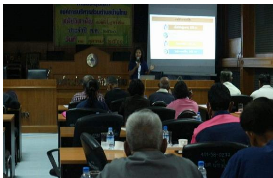
ภาพที่ 13 ภาพเวทีการคืนข้อมูล