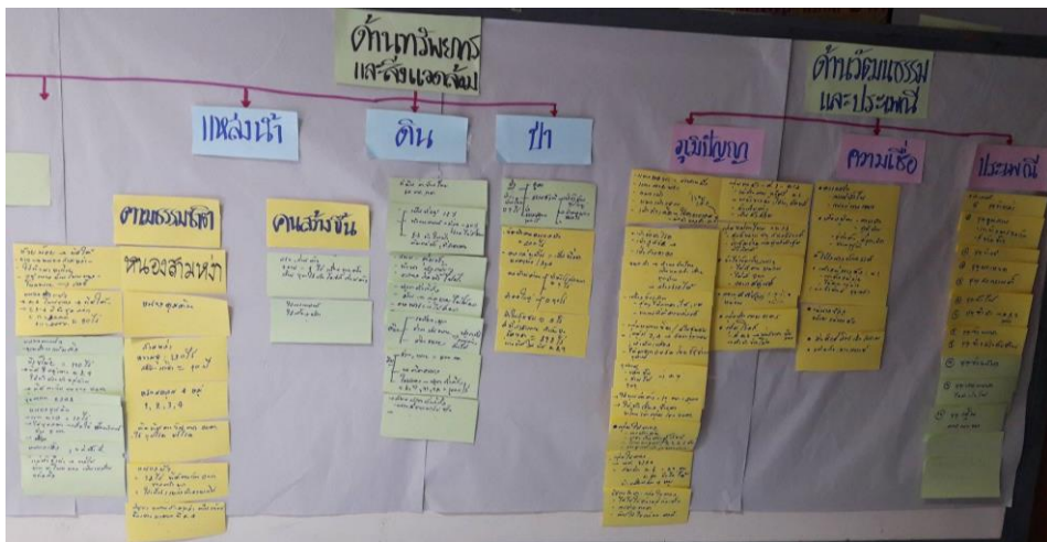
ภาพที่ 7 ภาพแตกกรอบบริบทชุมชน

หลังจากที่ทีมนักวิจัยประชุมเชิงปฏิบัติการแบบมีส่วนร่วมของชุมชน ทีมวิจัยได้ลงพื้นที่เพื่อสำรวจบริบทชุมชนเพิ่มเติม รายละเอียดแสดงดังภาพ