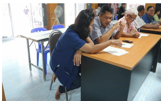
ภาพที่ 14 ภาพสัมภาษณ์เจาะลึกเพื่อศึกษาแนวทางที่เหมาะสมใจการจัดตั้งโรงเรียนผู้สูงอายุ