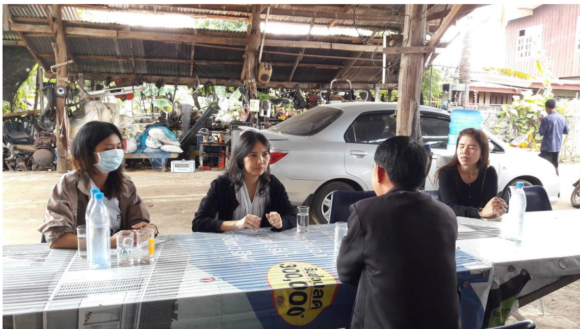
ภาพที่ 3 ภาพลงพื้นที่เพื่อสำรวจบริบทสำหรับเขียนข้อเสนอโครงการ