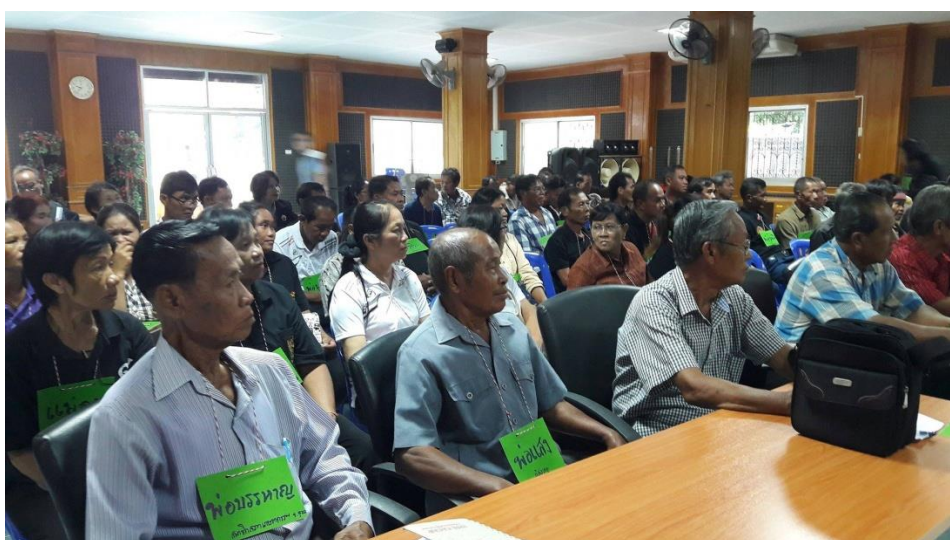
ภาพที่ 6 ภาพจัดประชุมเพื่อเพื่อชี้แจงวัตถุประสงค์ และอบรมเชิงปฏิบัติการการเก็บรวบรวมข้อมูลบริบทผู้สูงอายุแบบมีส่วนร่วม