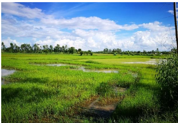
ภาพที่ 9 ภาพลักษณะบริบทชุมชนตำบลบ้านไทย