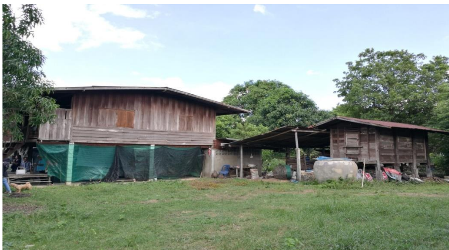
ภาพที่ 8 ภาพลักษณะบริบทชุมชนตำบลบ้านไทย