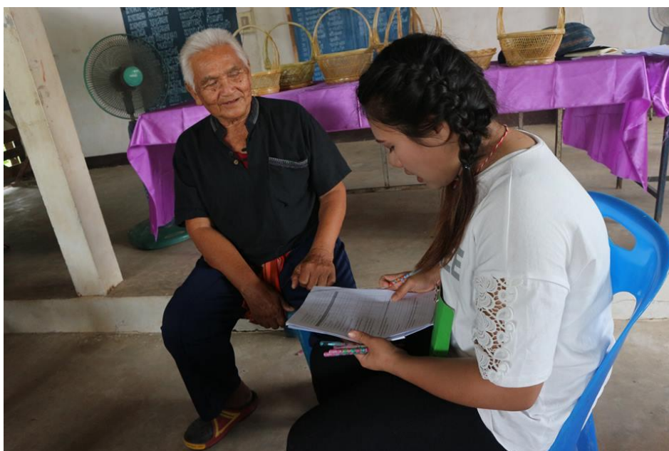
ภาพที่ 12 ภาพการสำรวจความเป็นไปได้เพื่อเตรียมความพร้อมในการจัดตั้งโรงเรียนผู้สูงอายุ ตามพื้นที่ทางสังคมและวัฒนธรรมตำบลบ้านไทย

2.3 วัตถุประสงค์ข้อที่ 3 เพื่อศึกษาแนวทางที่เหมาะสมเพื่อเตรียมความพร้อมในการจัดตั้งโรงเรียนผู้สูงอายุตามพื้นที่ทางสังคมและวัฒนธรรมตำบลบ้านไทย อำเภอเชิงใน จังหวัดอุบลราชธานี