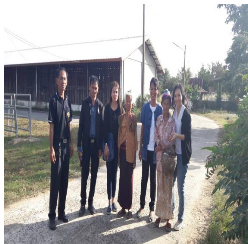
ภาพที่ 4 ภาพลงพื้นที่เพื่อเตรียมพื้นที่วิจัย