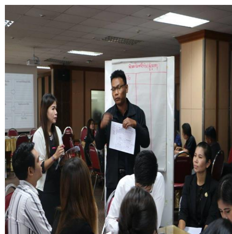
ภาพที่ 1 ประชุมทีมทำงานร่วมกับหน่วยวิจัยส่วนกลาง