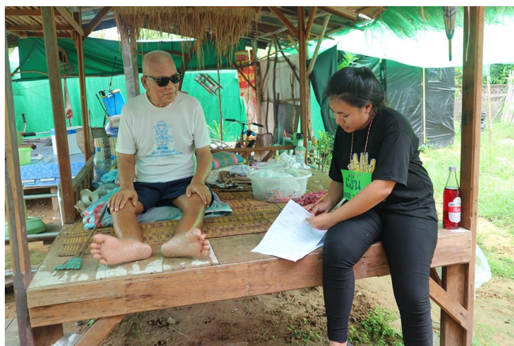
ภาพที่ 11 ภาพการสำรวจความเป็นไปได้เพื่อเตรียมความพร้อมในการจัดตั้งโรงเรียนผู้สูงอายุตามพื้นที่ทางสังคมและวัฒนธรรมตำบลบ้านไทย