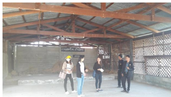
ภาพที่ 5 ภาพลงพื้นที่เพื่อค้นหาวิจัยในพื้นที่