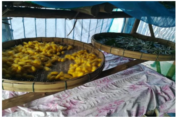
ภาพที่ 10 ภาพลักษณะประเพณีชุมชนตำบลบ้านไทย