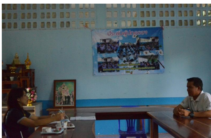
ภาพที่ 1 การทำความร่วมมือมีส่วนร่วมในการจัดการศึกษา