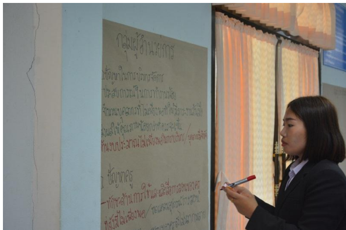
ภาพที่ 5 การทำความร่วมมือมีส่วนร่วมในการจัดการศึกษา