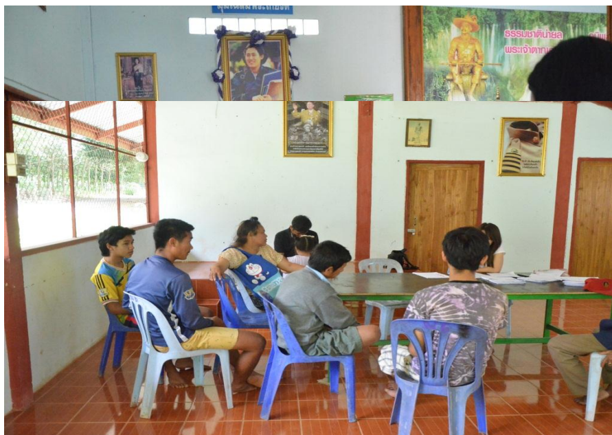
ภาพที่ 3 สัมภาษณ์ข้อมูล