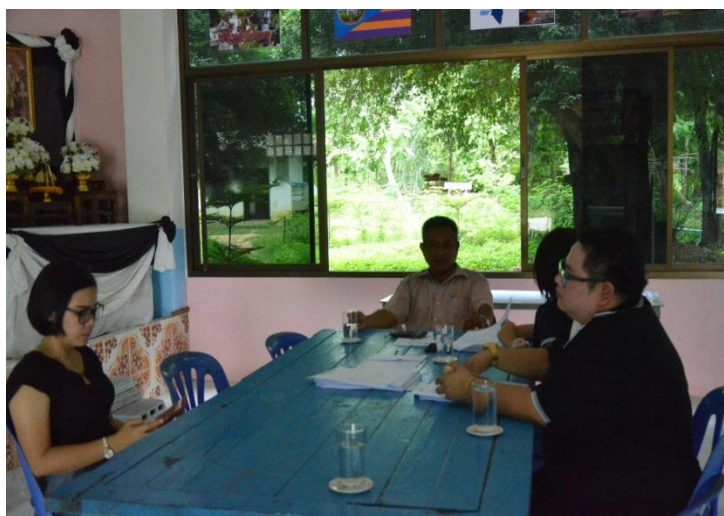
ภาพที่ 2 การทำความร่วมมือมีส่วนร่วมในการจัดการศึกษา