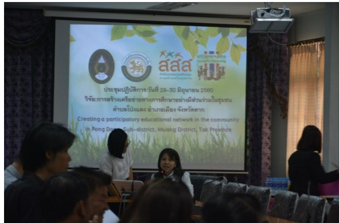
ภาพที่ 4 การทำความร่วมมือมีส่วนร่วมในการจัดการศึกษา