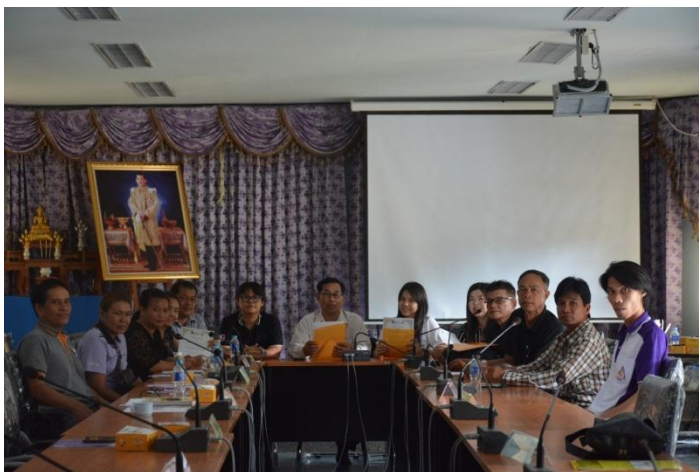
ภาพที่ 7 การทำความร่วมมือมีส่วนร่วมในการจัดการศึกษา