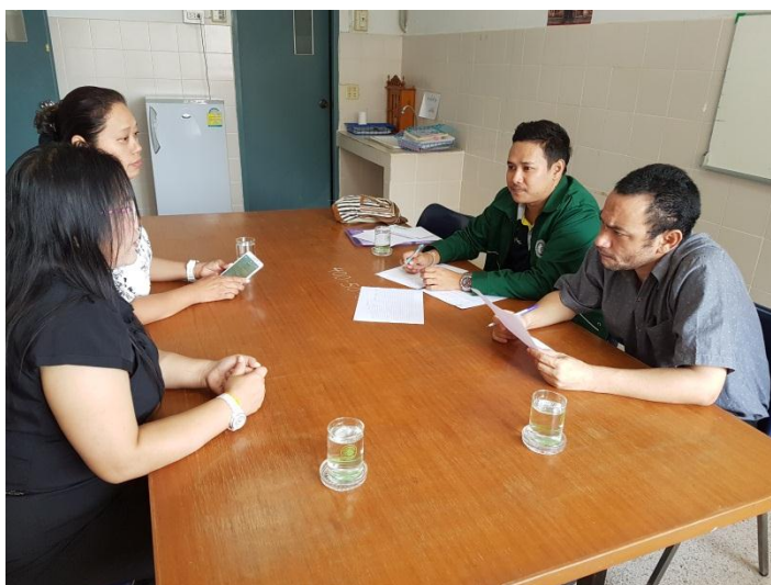
ภาพที่ 2-3 แสดงการลงพื้นที่การเก็บข้อมูล