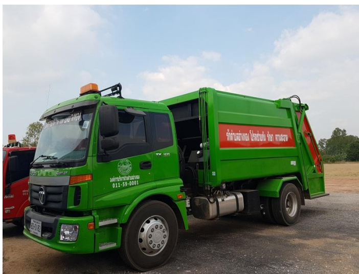
ภาพที่ 2-3 แสดงการลงพื้นที่การเก็บข้อมูล