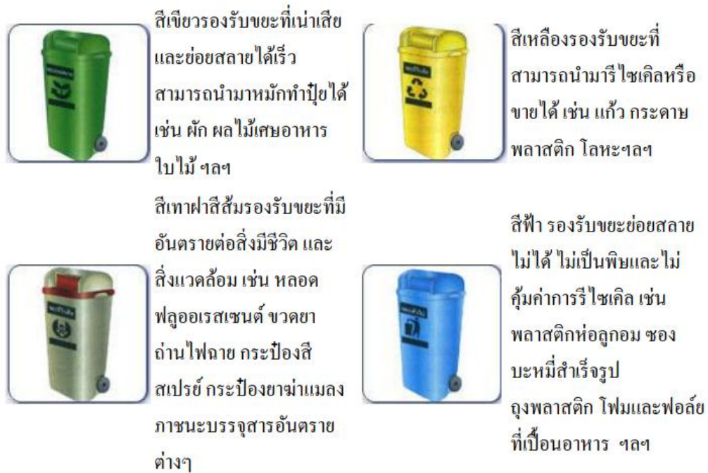
ภาพที่ 2.1 การแบ่งแยกประเภทของถังรองรับขยะมูลฝอยตามสีต่างๆ