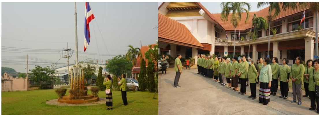
ภาพที่ 9 กิจกรรมเคารพธงชาติ