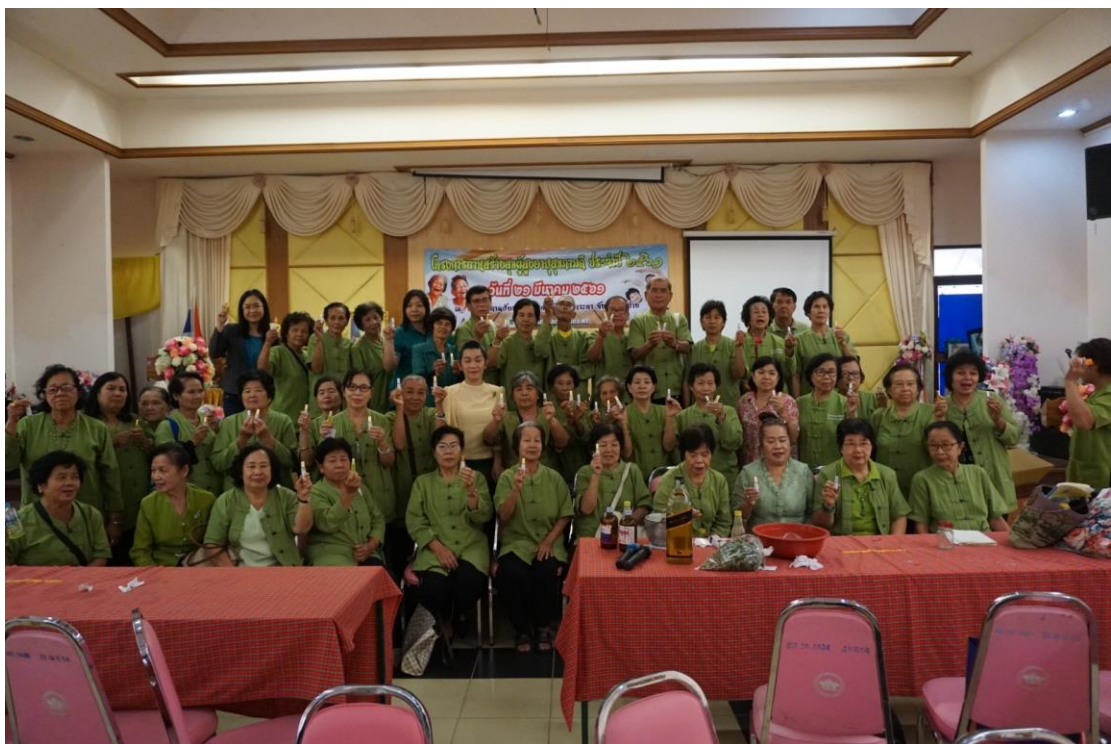
ภาพที่ 16 ผลิตภัณฑ์พิมเส่น้ำและน้ำมันไพล จากการอบรมหลักสูตรผลิตภัณฑ์สมุนไพรสำหรับผู้สูงอายุ และภาพถ่ายหมู่สมาชิกโรงเรียนผู้สูงอายุที่เข้าร่วมการอบรม