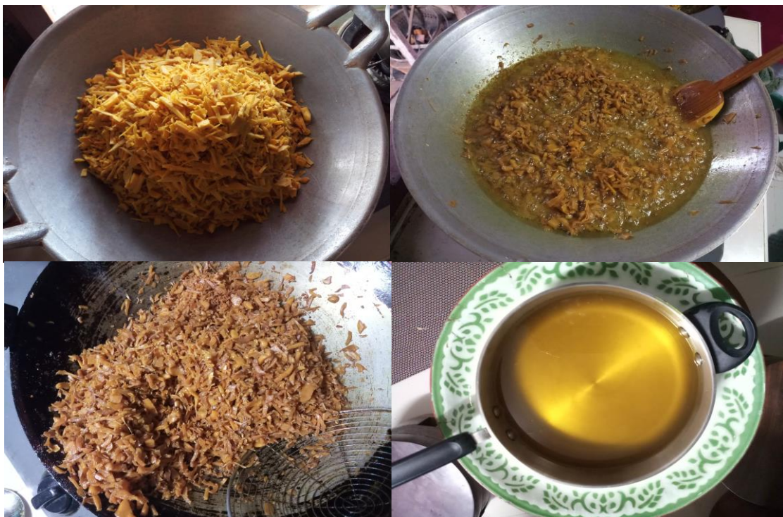
ภาพที่ 14 การเตรียมไพลสำหรับทำน้ำมันจากไพล