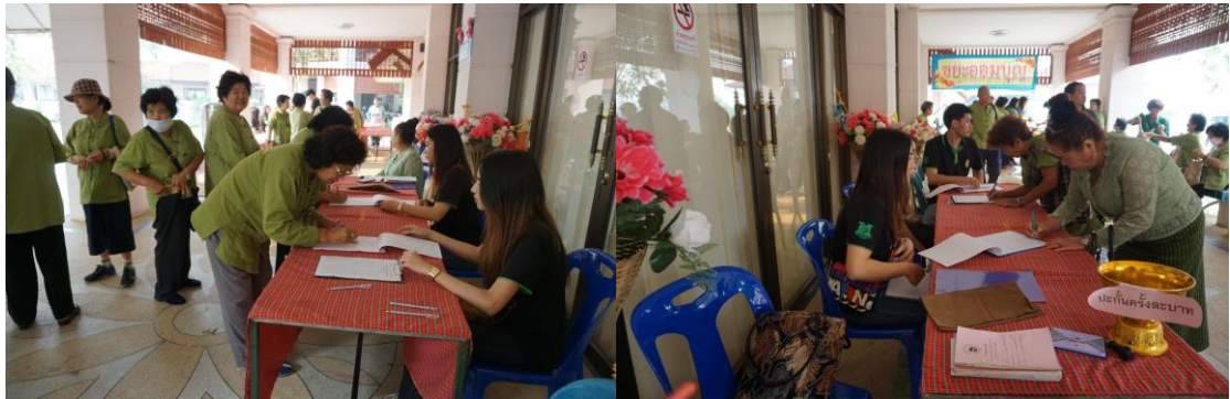
ภาพที่ 6 จุดลงทะเบียน และกิจกรรมออมเงินวันละบาท