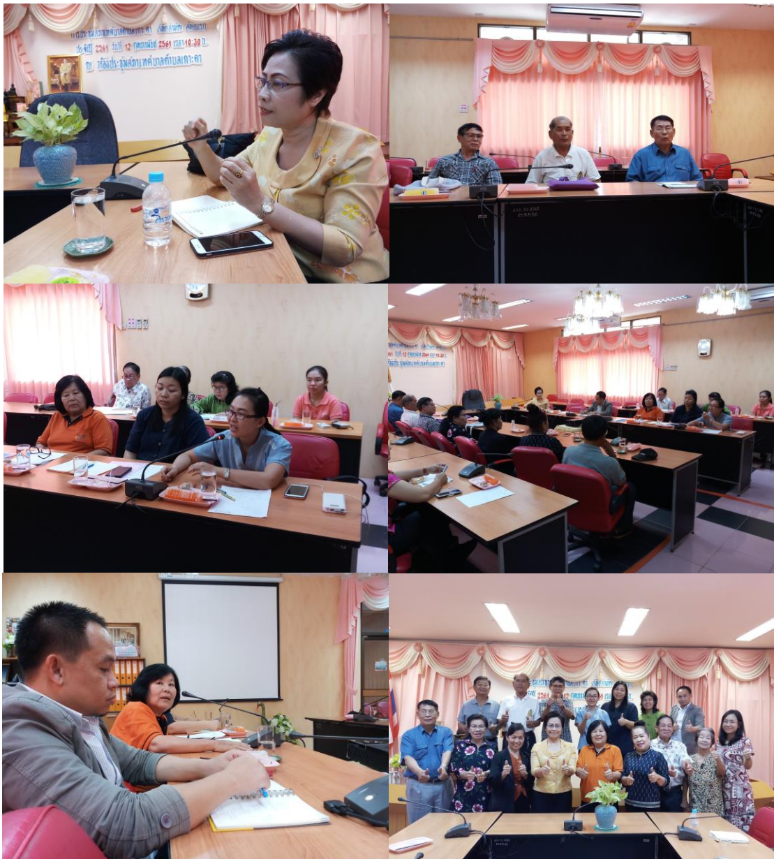
ภาพที่ 5 การจัดประชุมเสวนากลุ่มย่อยเพื่อย้ำข้อมูลและวิเคราะห์แนวทางการพัฒนาหลักสูตรอบรม

จากผลการวิเคราะห์แนวทางการพัฒนาหลักสูตรอบรมเพื่อคุณภาพชีวิตของผู้สูงอายุ ซึ่งมีการระดมความต้องการจากตัวแทนของโรงเรียนผู้สูงอายุเทศบาลตำบลเกาะคา ผู้แทนเทศบาลตำบลเกาะคา ผู้แทนหน่วยงานซึ่งดูแลทางด้านสุขภาพของผู้สูงอายุ อาทิ พยาบาลวิชาชีพจากโรงพยาบาลเกาะคา โรงพยาบาลส่งเสริมสุขภาพตำบล รวมทั้งภาคีเครือข่ายต่างๆ อันนำไปสู่ข้อสรุปและแนวทางการพัฒนาหลักสูตรการอบรมสำหรับผู้สูงอายุตามความต้องการของผู้สูงอายุคือการจัดทำ