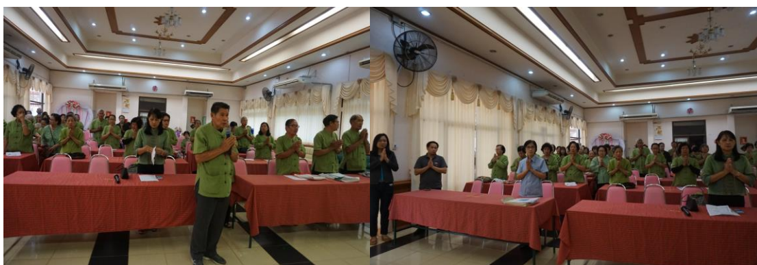
ภาพที่ 10 กิจกรรมสวดมนต์