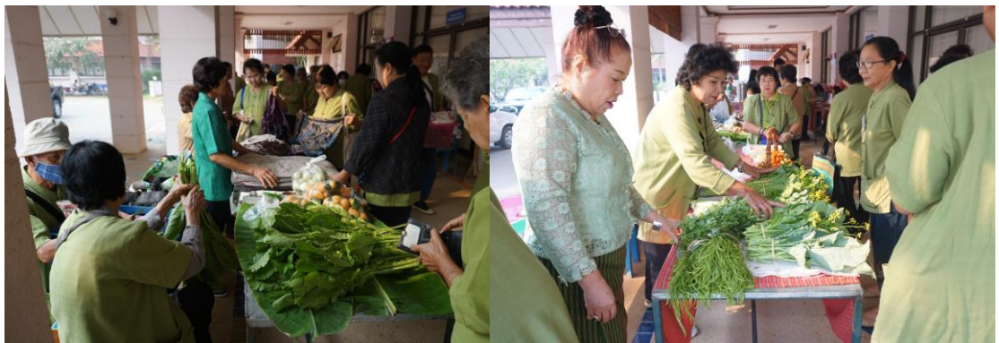
ภาพที่ 8 จุดจำหน่ายสินค้าในครัวเรือนของผู้สูงอายุ