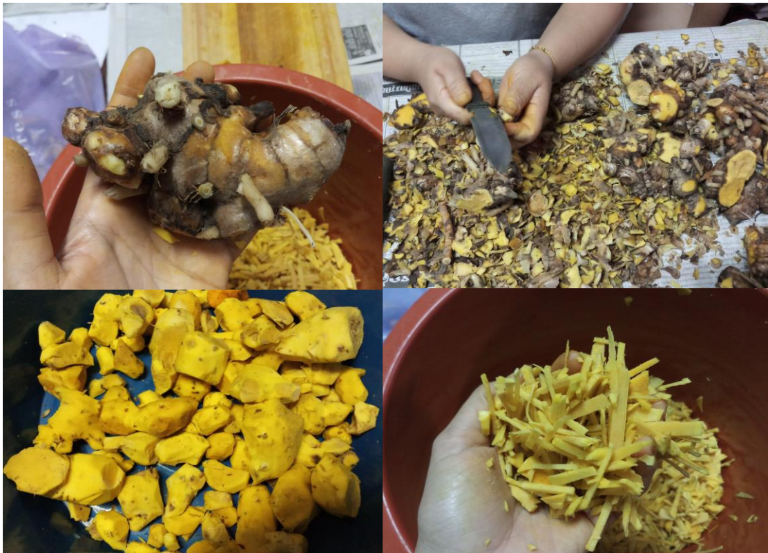
ภาพที่ 13 การสาธิตขั้นตอนการเตรียมไพล