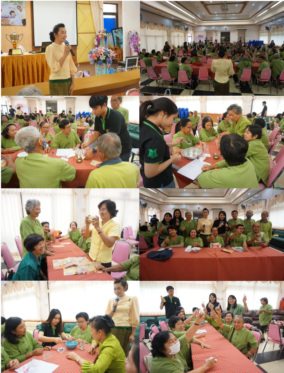
ภาพที่ 12 กิจกรรมการอบรมการผลิตพืมน้ำ

ทั้งนี้กิจกรรมการทำพืมน้ำและการทำน้ำมันนวดไพล ได้จัดแบ่งกลุ่ม 10 กลุ่มๆ ละ 12-15 คน โดยมีนักศึกษาปริญญาตรี สาขาวิชาการจัดการ เป็นผู้ช่วยประจำกลุ่มให้กับผู้สูงอายุ ซึ่งมี