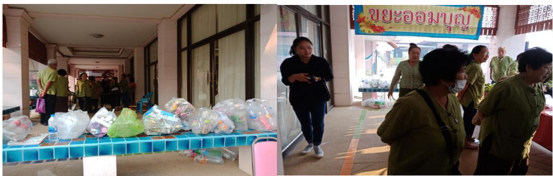
ภาพที่ 7 จุดลงทะเบียน “ขยะออมบุญ”