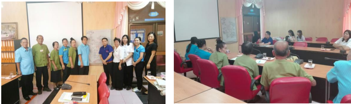
ภาพที่ 3 การเสวนากลุ่มย่อยครั้งที่ 1 ถอดประเด็นปัญหาผู้สูงอายุเทศบาลตำบลเกาะคา