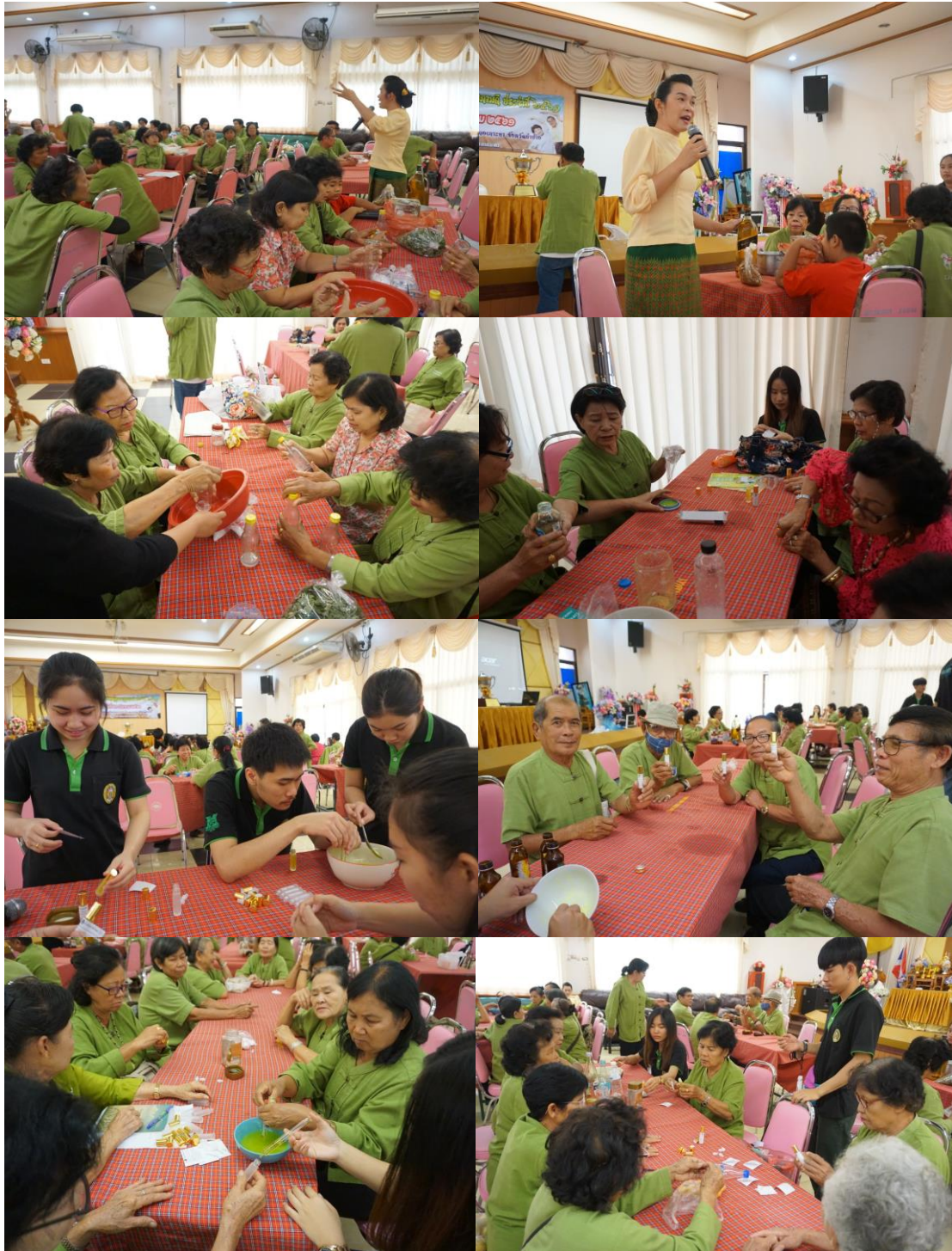
ภาพที่ 15 กิจกรรมการทำน้ำมันพืดงภาพ

ทั้งนี้ในการดำเนินการอบรมเชิงปฏิบัติการ ผู้วิจัยได้กำหนดให้การอบรมในแต่ละหลักสูตร ดำเนินกิจกรรมไปที่ละหลักสูตร ซึ่งภายหลังเสร็จสิ้นการอบรมหลักสูตรผลิตพืมน้ำมันแล้ว จึงตามด้วยการผลิตน้ำมันพลัดงภาพต่อไปนี้