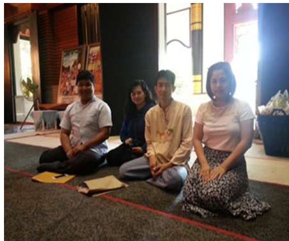
นักวิจัยจากมหาวิทยาลัยราชภัฏลำปางและนักวิจัยในท้องถิ่น