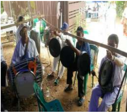
ภาพที่ 12 แสดงการขยายผลของผู้สูงอายุในการการแสดงดนตรีพื้นบ้านในงานประเพณีต่างๆ ของชุมชน