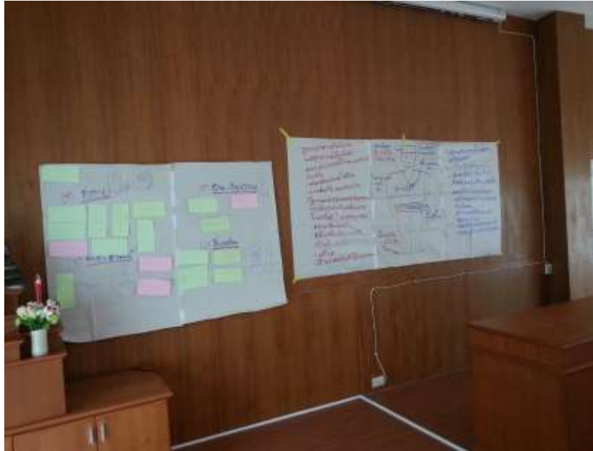
ภาพที่ 3 แสดงผลการจัดกิจกรรมวิเคราะห์ปัญหาและความต้องการของกลุ่มผู้สูงอายุในชุมชน