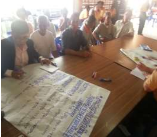
ภาพที่ 5 แสดงการมีส่วนร่วมของผู้สูงอายุในการวางแผนดำเนินกิจกรรมวิจัย