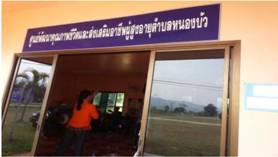
ภาพที่ 9 แสดงการกิจกรรมการออกกำลังกายภายใต้กิจกรรมของโครงการวิจัย โดยใช้ดนตรีและศิลปวัฒนธรรมพื้นบ้านล้านนา