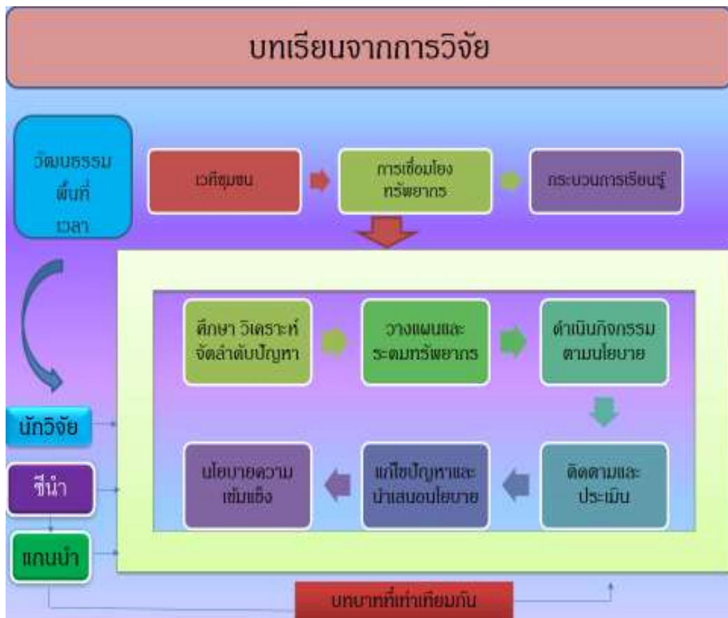
แผนภาพที่ 2 บทเรียนจากกระบวนการวิจัย

การวิจัยเรื่อง นโยบายเพื่อการพัฒนาเครือข่ายความเข้มแข็งทางสุขภาพผ่านการประยุกต์ ศิลปะการแสดงและการต่อสู้ล้านนาของกลุ่มผู้สูงอายุ ตำบลหนองบัว อำเภอไชยปราการ จังหวัดเชียงใหม่ มีกระบวนการขับเคลื่อนกิจกรรมเพื่อนำไปสู่การมีส่วนร่วมของชุมชน เพื่อสร้างความเข้มแข็งของกลุ่มผู้สูงอายุ และสามารถพัฒนาเป็นข้อเสนอเชิงนโยบายตามกลยุทธ์ต่างๆ สามารถอธิบายตามข้อสรุป ดังนี้