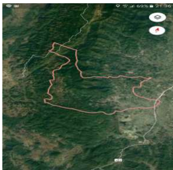
ภาพที่ 1 แสดงที่ตั้งอาณาเขตตำบลหนองบัว อำเภอไชยปราการ จังหวัดเชียงใหม่