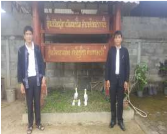
ภาพที่ 13 แสดงกิจกรรมลงติดตามและประเมินผลร่วมกับชุมชน