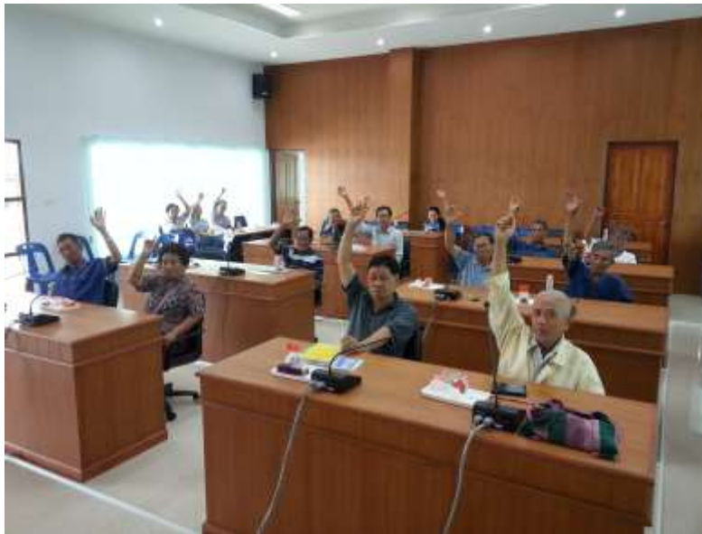
ภาพที่ 4 แสดงมติในการเลือกกิจกรรมเพื่อพัฒนาความเข้มแข็งให้กับกลุ่มผู้สูงอายุในชุมชน

จากการระดมพลังสมองพิจารณาเห็นพ้องต้องกันว่าหากจะใช้ยุทธศาสตร์เพื่อก่อให้เกิดกิจกรรมการรวมกลุ่มที่เหมาะสมแล้วสามารถดำเนินการได้ตามศักยภาพและต้นทุนที่มีอยู่ในชุมชน จะสามารถขยายผลไปสู่กิจกรรมอื่นๆ ที่จะเป็นประโยชน์ต่อการพัฒนาคุณภาพชีวิตผู้สูงอายุ จึงมีมติที่จะเลือกสร้างพลังความเข้มแข็งให้กับกลุ่มผู้สูงอายุในแต่ละชุมชน โดยใช้การศิลปะการแสดงและการต่อสู้ของล้านนา เพื่อใช้เป็นกิจกรรมที่ช่วยประสานความร่วมมือระหว่างผู้สูงอายุจากชุมชนต่างๆ มาร่วมกันทำกิจกรรมและร่วมแลกเปลี่ยนเรียนรู้ ซึ่งจะเป็นเวทีการเรียนรู้เพื่อร่วมสร้างรากฐานของเครือข่ายผู้สูงอายุในระดับตำบลและเป็นช่องทางนำไปสู่การดำเนินกิจกรรมอื่นๆ ที่ขยายผลในระดับต่อไป