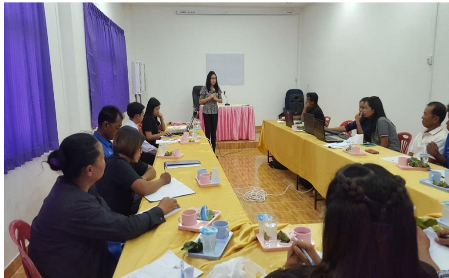
ภาพที่ 5.4 อบรมเชิงปฏิบัติการเพิ่มศักยภาพของคณะกรรมการกองทุนสวัสดิการชุมชน ระยะที่ 3 ระยะสรุปผล/ประเมินผลการศึกษา

คณะผู้วิจัยได้ทำการสรุปผลและประเมินผลข้อมูลเพื่อให้ตรงตามวัตถุประสงค์ของการวิจัย โดยการถอดบทเรียนภาพรวมการดำเนินงานของโครงการวิจัย (Retrospect) เพื่อกำหนดทิศทางการดำเนินงานของกองทุนสวัสดิการกองทุนในอนาคต และทำการวิเคราะห์ข้อมูล พบว่า