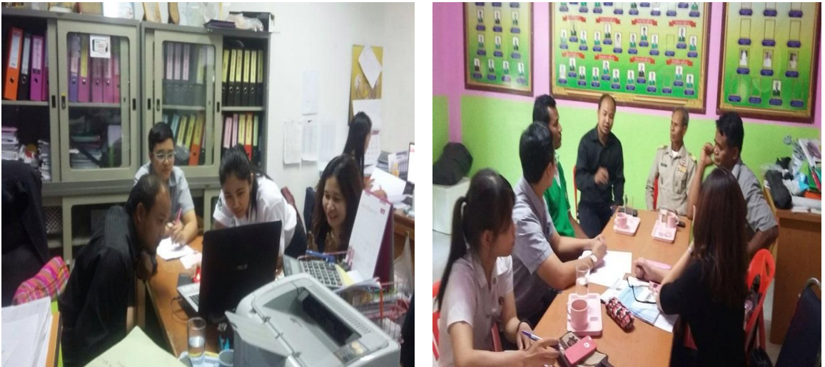
ภาพที่ 5.3 คณะผู้วิจัยเก็บรวบรวมข้อมูลเชิงลึกกับคณะกรรมการกองทุนสวัสดิการชุมชน

ทางผู้วิจัยจึงได้มีข้อสรุปกับตัวแทนของชุมชนว่าทางทีมวิจัยจะจัดให้มีการให้ความรู้และแนวทางเกี่ยวกับระบบการพัฒนาระบบฐานข้อมูลทางการเงิน รวมทั้งอบรมบทบาท หน้าที่ของคณะกรรมการกองทุนสวัสดิการชุมชน โดยจะเชิญผู้เชี่ยวชาญทางด้านคอมพิวเตอร์และด้านการบริหารจัดการโดยตรงมาถ่ายทอด ซึ่งจะมีการจัดอบรมเชิงปฏิบัติการเพื่อให้เกิดการบริหารจัดการกองทุนสวัสดิการชุมชนที่เหมาะสมในพื้นที่ตำบลเมืองบัว อำเภอชุมพลบุรี จังหวัดสุรินทร์ ตามความต้องการของกองทุนสวัสดิการชุมชนอย่างแท้จริง