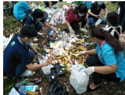
7) ทำการตัดแยกองค์ประกอบของมูลฝอย