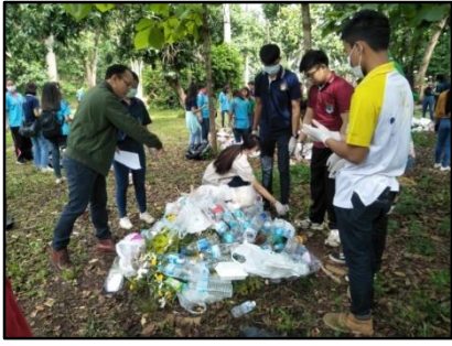
1) สุ่มตัวอย่างมูลฝอยจากกองมูลฝอย