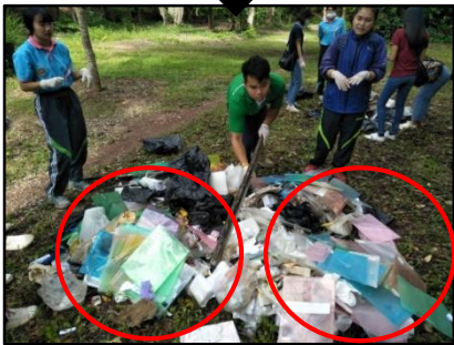
5) เลือก 2 กองที่อยู่ตรงกันข้าม