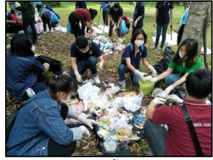
2) ฝึกมูลฝอยออกเป็นชิ้นเล็กๆ