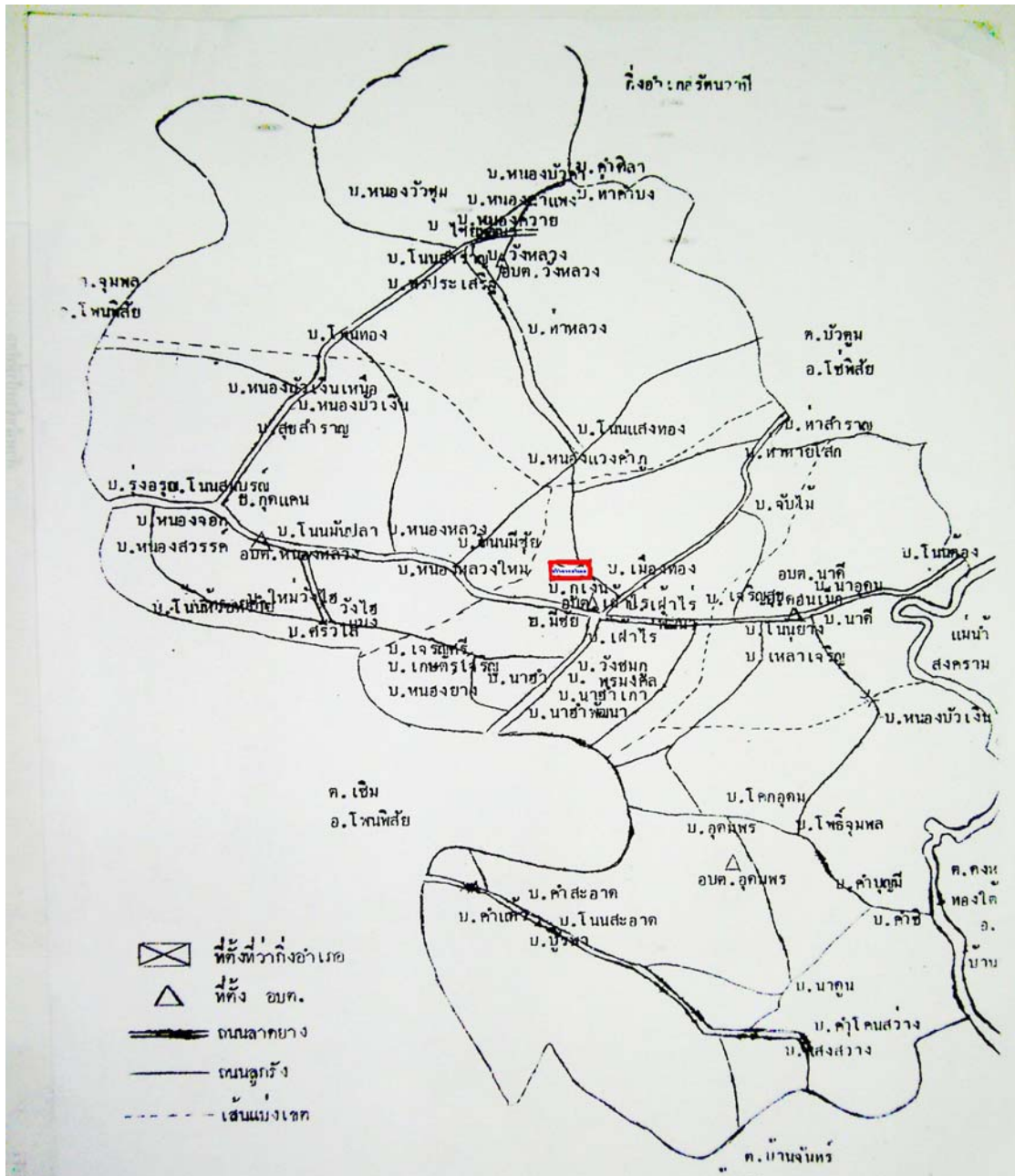
ภาพที่ 4.1 ลักษณะแผนผังตำบลไผ่ไร่ อำเภไผ่ไร่ จังหวัดหนองคาย