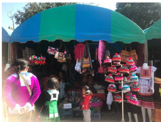
ลงพื้นที่ครั้งที่ 2 เพื่อสัมภาษณ์เชิงลึกและ สังเกตหน้าร้าน