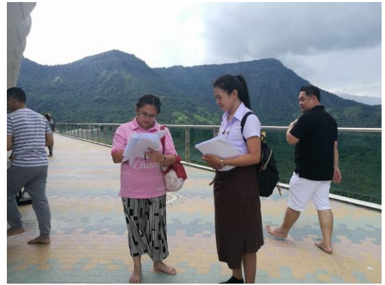
ลงพื้นที่ครั้งที่ 3 เพื่อเก็บแบบสอบถามจากนักท่องเที่ยว ณ วัดผาซ่อนแก้ว