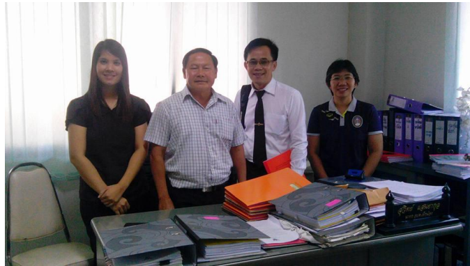
ลงพื้นที่ครั้งที่ 1 เพื่อศึกษาถึงปัญหาและบริบททั่วไปของผู้สูงอายุตำบลเข็กน้อย