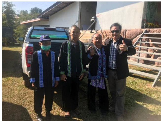
ลงพื้นที่ครั้งที่ 4 เพื่อถ่ายทอดผลการวิจัยสู่ชุมชน