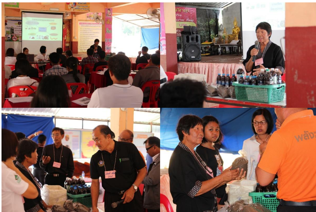
ภาพที่ 5.7 การนำเสนอการเลี้ยงไส้เดือนดินของตัวแทนตำบลเมืองพล อำเภอพล จังหวัดขอนแก่น ที่มา : โรงเรียนบ้านร่องคำวิทยา ต.ป่าสังข์ อ.จตุรพักตรพิมาน จ.ร้อยเอ็ด วันที่ 17-18 มีนาคม 2560