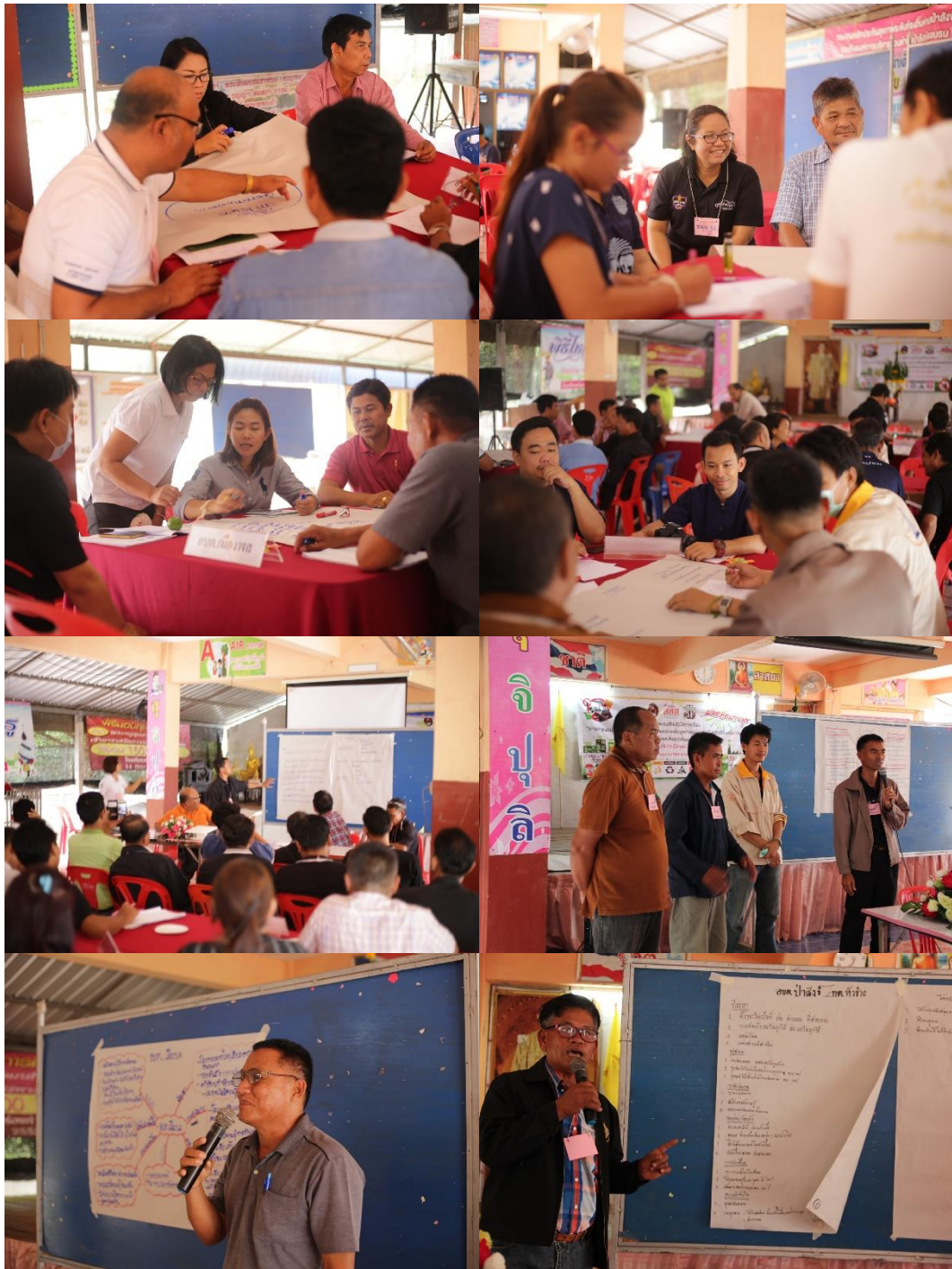
ภาพที่ 5.9 การนำเสนอแลกเปลี่ยนบทเรียนของแต่ละกลุ่มที่ได้รับจากการประชุมเชิงปฏิบัติการ ที่มา : โรงเรียนบ้านร่องคำวิทยา ต.ป่าสัก อ.จตุรพักตรพิมาน จ.ร้อยเอ็ด วันที่ 17-18 มีนาคม 2560