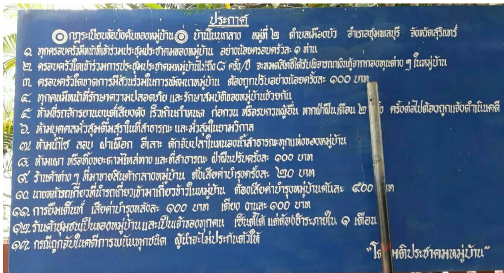
ภาพที่ 5.4 กฎระเบียบข้อบังคับของบ้านโนนกลาง ตำบลเมืองบัว อำเภอชุมพลบุรี จังหวัดสุรินทร์