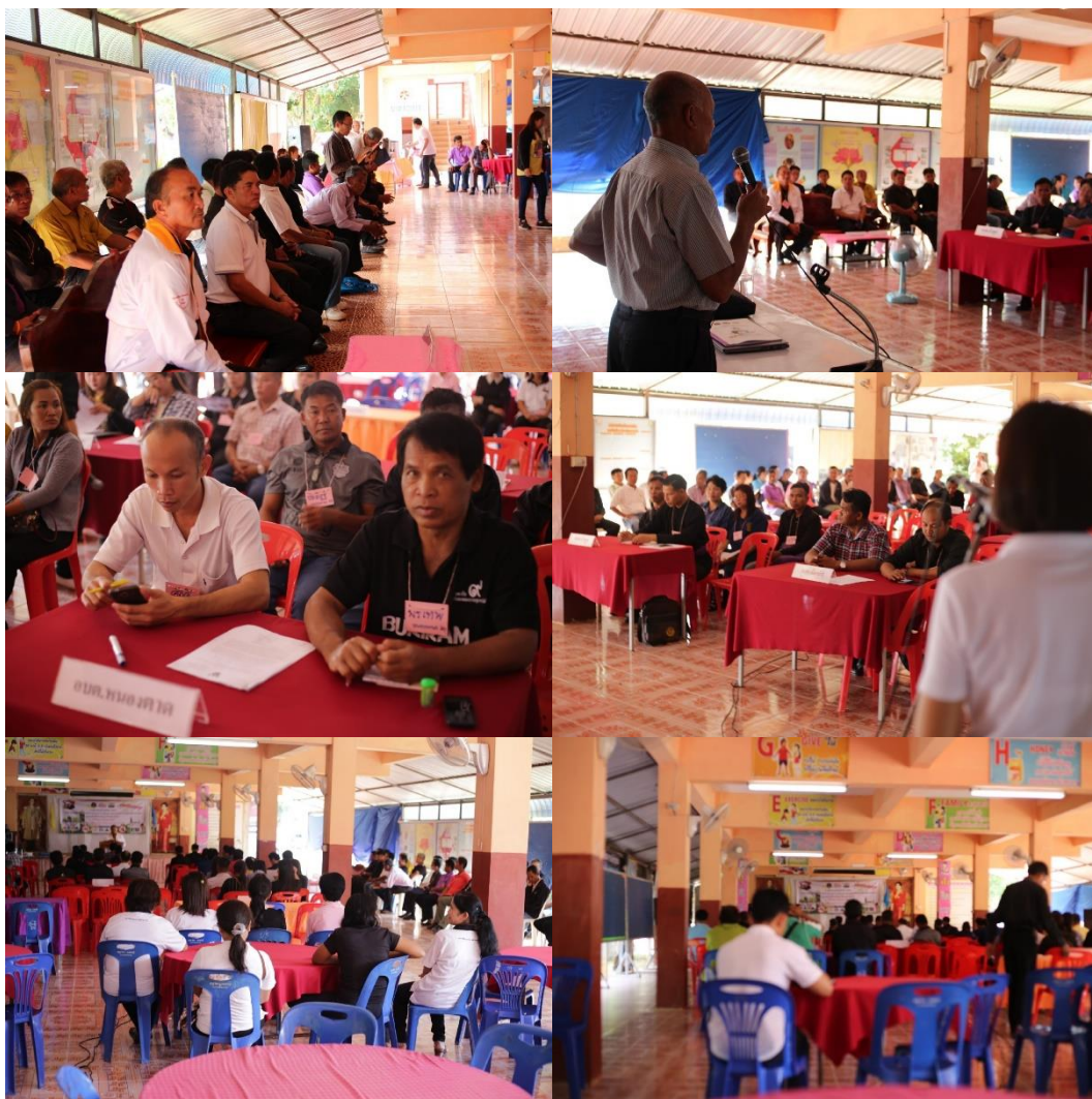
ภาพที่ 5.2 การประชุมเชิงปฏิบัติการการแลกเปลี่ยนเรียนรู้การจัดการขยะในครัวเรือน ที่มา : โรงเรียนบ้านร่องคำวิทยา ต.ป่าสัก อ.จตุรพักตรพิมาน จ.ร้อยเอ็ด วันที่ 17-18 มีนาคม 2560