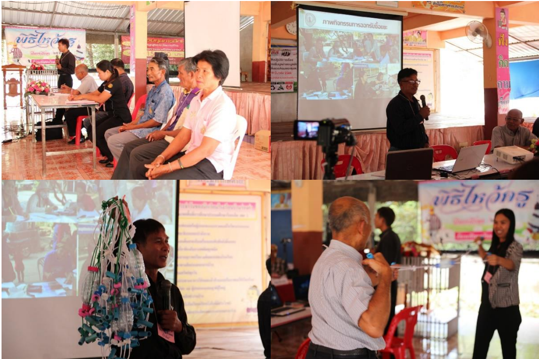
ภาพที่ 5.6 การนำเสนอการดำเนินงานของผู้นำ ตำบลป่าสัก อ.จตุรพักตรพิมาน จ.ร้อยเอ็ด ที่มา : โรงเรียนบ้านร่องคำวิทยา ต.ป่าสัก อ.จตุรพักตรพิมาน จ.ร้อยเอ็ด วันที่ 17-18 มีนาคม 2560