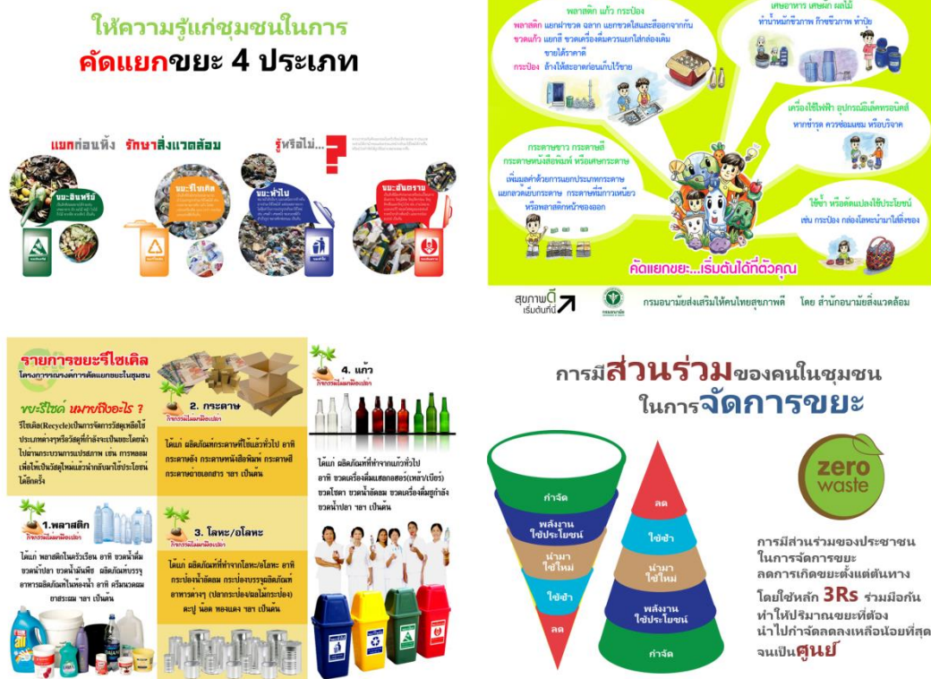
ภาพที่ 5.1 หลักการคัดแยกขยะและการจัดการขยะตามหลัก 3Rs

เน้นการให้ความรู้พื้นฐานในการคัดแยกขยะ การมีส่วนร่วมของประชาชน ในการจัดการขยะ ลดการเกิดขยะตั้งแต่ต้นทาง ให้ปริมาณขยะที่จะต้องนำไปกำจัดลดลงเหลือน้อยที่สุดจนเป็นศูนย์