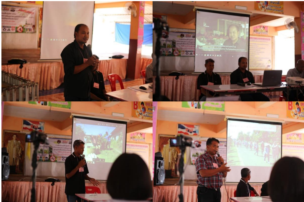
ภาพที่ 5.3 ผู้นำบ้านโนนกลาง ตำบลเมืองบัว อำเภอชุมพลบุรี จังหวัดสุรินทร์ ในการประชุมเชิงปฏิบัติการการแลกเปลี่ยนเรียนรู้การจัดการขยะในครัวเรือน ที่มา : โรงเรียนบ้านร่องคำวิทยา ต.ป่าสังข์ อ.จตุรพักตรพิมาน จ.ร้อยเอ็ด วันที่ 17-18 มีนาคม 2560